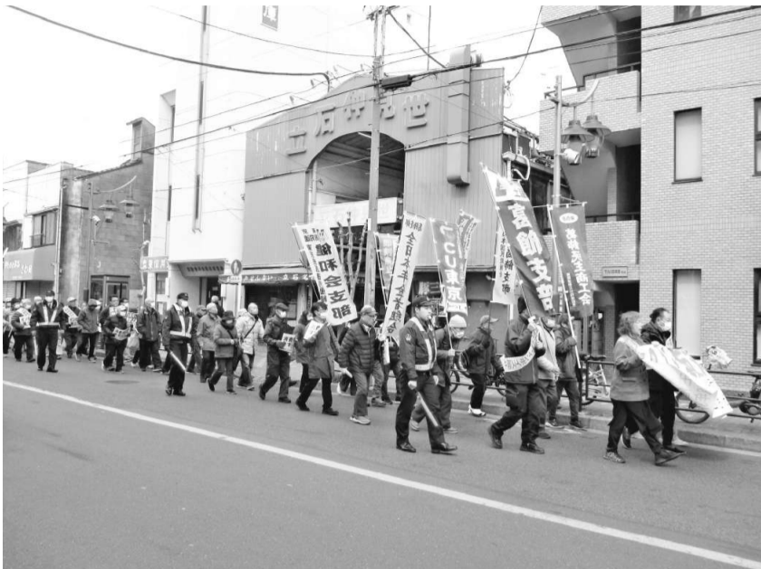
奥戸街道をデモ行進

今年で57回を数える重税反対葛飾区民集会。税務署への集団申告と同時に開催する重税反対区民集会は3月13日(金)に渋江公園で開催し、民商や他団体を含め、100人、