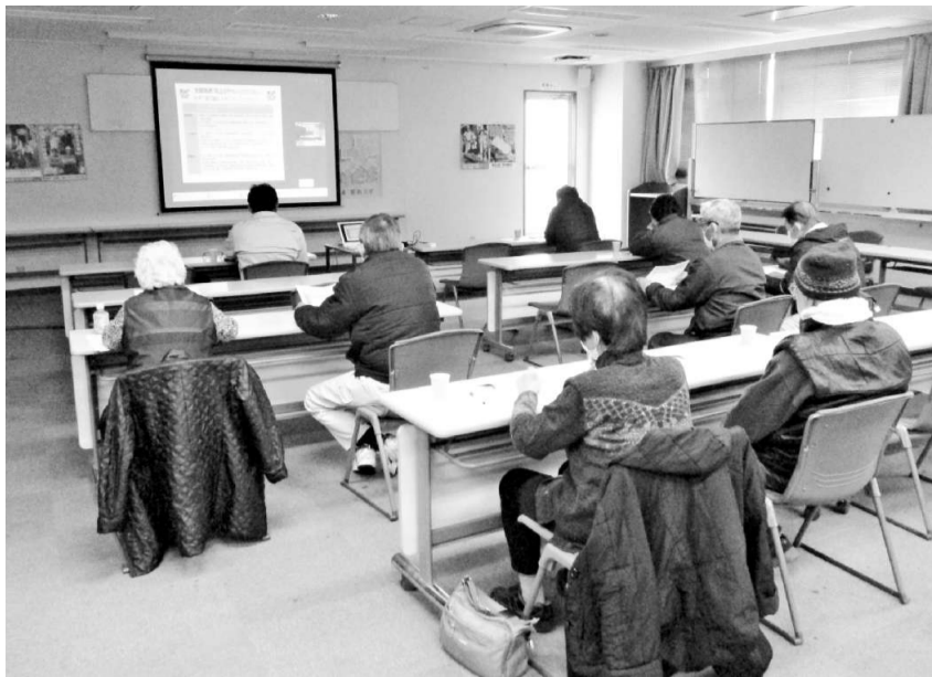
全国を対象とした賃上げ大学学習会をwebで参加