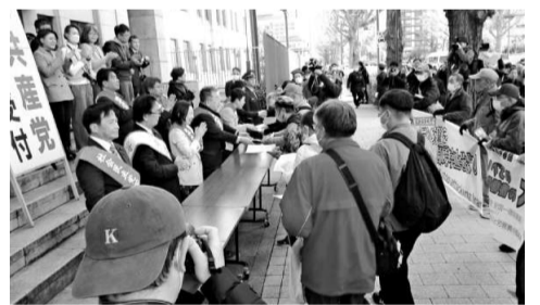
議員へ個人署名を手渡し