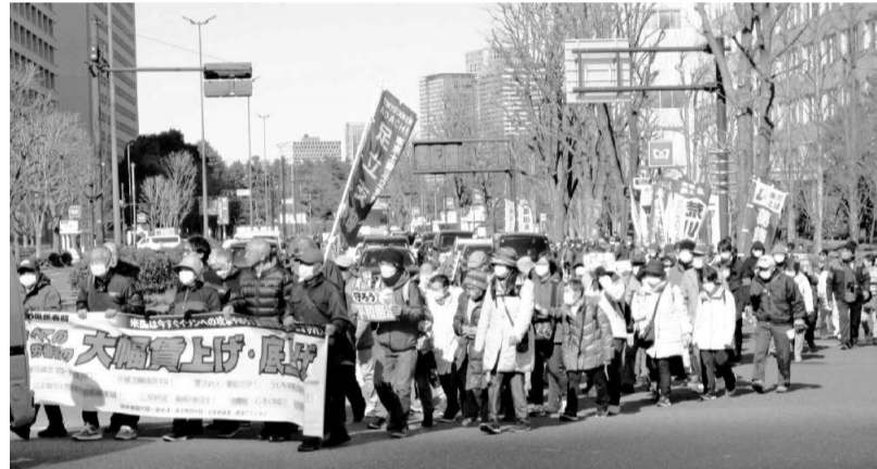
日比谷公園から国会議事堂までデモ行進

賃金引上げを 求める26春闘、 3・5中央総決 起行動を3月5 日(木)日比谷 公園で開催。国 民春闘共闘、全 労連、東京春闘 共闘、全国食健 連とともに、東 京土建を含む建 設関係の労働組 合の建設アクシ ョン実行委員会 による行動で、 全体で2000 人、葛飾支部か らは25人が参加 しました。