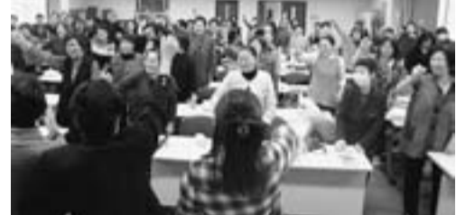
主婦の会総会で最後はガンバロー

去年は震災の翌日12日、不安いっぱいの中での開催を、参加者の多くの方が思い出したことでしょう。