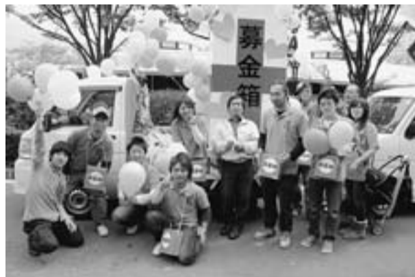
青年部はメーデーで募金箱のデコを作成

6月に行なわれた住宅デーでは、各分会で震災募金を募ると共に、幸田分会がいち早く震災復興を取り入れ、現地の名産物の展開をしました。