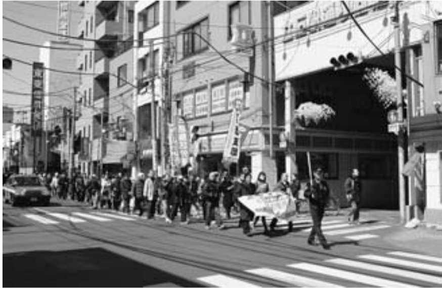
渋江公園から奥戸街道を通過して税務署までデモ行進

〒124-0012 葛飾区立石8-34-4 電 話 (5698) 1 2 6 1 F A X (5698) 1 2 6 2 発行人 細 貝 文 洋