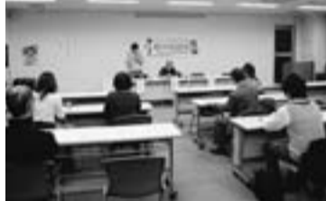
青年部総会には他支部・団体からの参加も

参加者は葛飾支部青年部からは8人、来賓では、葛飾支部柳生副委員長及び阿久津後継者対策部長、本部青年部役