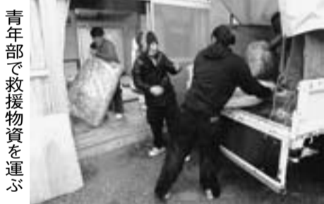
青年部で救援物資を運ぶ

引き受けた以上は、私なりのやり方で、みなさんにお手伝いさせていただいてやっていき、シニアの会を盛り上げていきたい。また、本部では他支部の人たちとも会います。色んな人と会って、吸収して、葛飾を良くしていきたいと思っています。