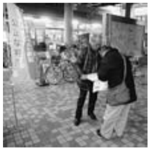
青砥駅頭で署名活動