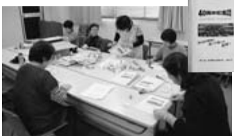
主婦の会記念誌作り

決されました。介護保険法・TPP問題など、わたしたち「主婦の会」は、くらしを守るため組合とともに常に学び、運動を続けていこうとみんなで確認し、無事総会を終えました。