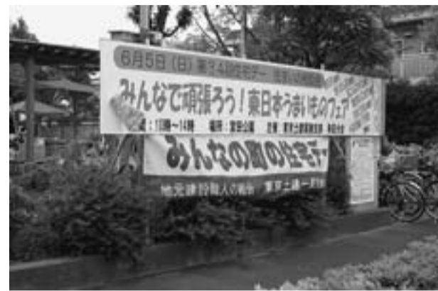
幸田分会は昨年の住宅デーで独自の復興支援を行う

私たち葛飾支部においても、震災復興に向けた取り組みで、みなさんの協力から、被災地へ送った震災募金をはじめ、様々な取り組みをしてきました。