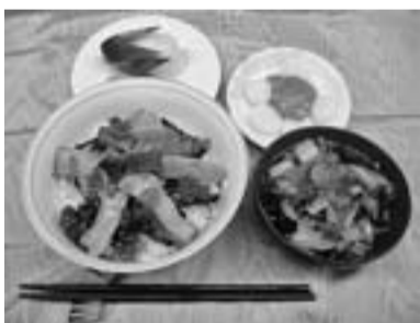
美味しくできあがりしました!!

ことしのテーマは、やはり震災を意識し、東北地方の郷土食を取り上げてみました。鮭が川に戻ってくる10月から12月にかけて阿武隈川河口の荒浜地区で作られる伝統郷土食の鮭やイクラをのせた「はらこ飯」をはじめ、福島は会津藩の武家料理の「こづゆ」。デザートには岩手で良く食べられるクルミをつかい、お餅の代わり