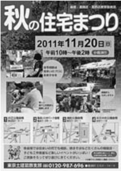
秋の住宅まつりチラシ