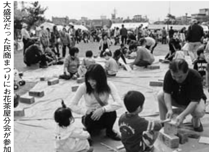
大盛況だった民商まつりにお花茶屋分会が参加

に白玉で「くるみ白玉」を作りました。震災と長い復興の道のりの東北を忘れないでいましょう。