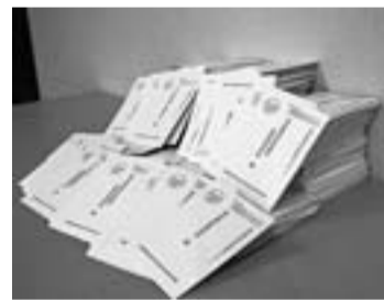
集まった対都要請ハガキ(10月25日)

11月・12月初旬は補助金確保ヘラストスパートです。財務省はがき要請行動にご協力下さい。