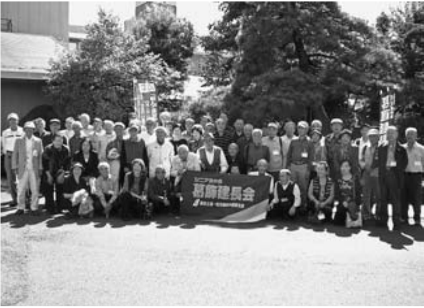
56人が参加して1日楽しんだ建長会バスハイク

【建長会】10月6日(木)雨のち快晴の秋空のもと「石和温泉・ワインぶどう狩りと豪華な食事と平和を学ぼう」と1日バスハイクに56人の会員が参加。都内の朝の渋滞に少し巻き込まれたが、おおよそ予定通りに山梨平和ミュージアムに到着。戦時中の生活・教育や軍隊の様子に思いをはせ、しっかり勉強。中には、経験者もいて「大変だったよな」など感想も。そのあとは、お待ちかねの温泉と昼食。石和温泉のいい湯でくつろいだ後、豪華な食事で大満足! イッパイ入ったところで、カラオケも飛び出し、建長会パワーにはビックリ! 午後のワインの試飲に、ぶどうの食べ放題では、一心不乱に食べまくり! 帰りにはビンゴもあって最後まで楽しく過ごしました。また違う分会の参加者に、むかしの仲間の顔を見つけた、と交流もすすみ、大満足のバス旅行でした。