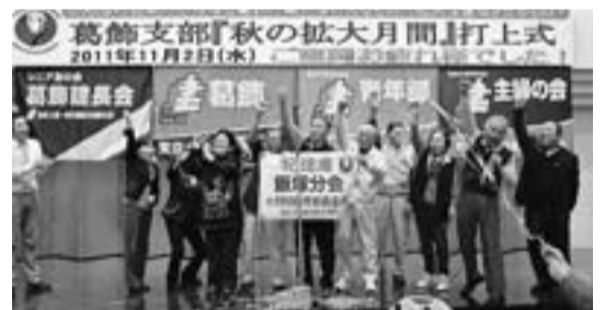
各分会が登壇しクラッカーをならしながら表彰(飯塚分会)