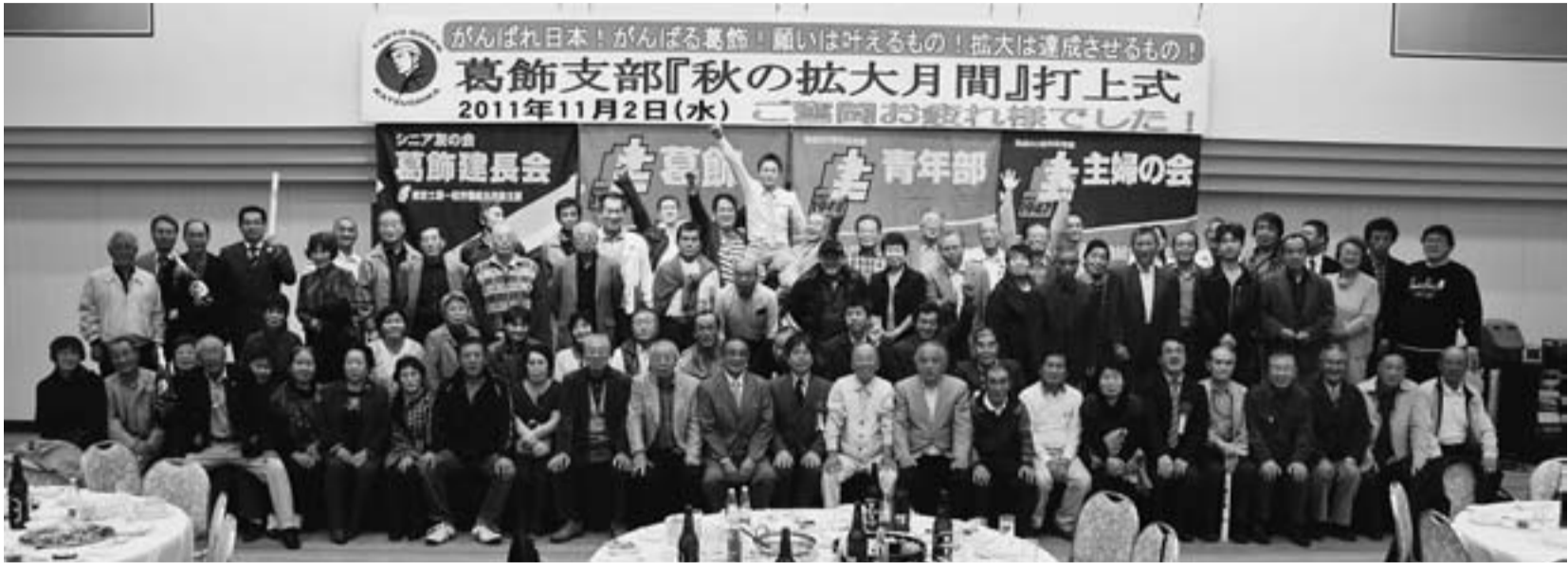
打上式最後にみんなで集まって記念撮影『達成したぞ!!』 テクノプラザかつしか

〒124-0012 葛飾区立石8-34-4 電話 (5698) 1261 FAX (5698) 1262 発行人 細貝文洋