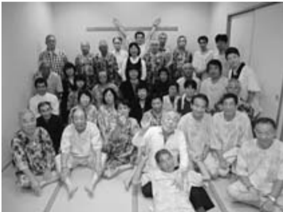
42人が参加し今年も楽しみました(東新小岩)

毎年恒例の東新小岩分会のレクリエーション。今年も昨年に続き奥戸の「古代の湯」で10月2日(日)に開催しました。交流のある西新小岩分会から6人、二葉分会からは5人が参加し、計42人の参加でした。