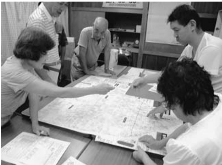
組合員訪問用の地図に落とし込み(北水元)