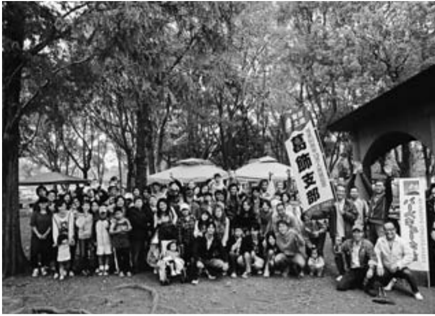
親子で1日楽しんだBBQ大会 (水元公園)