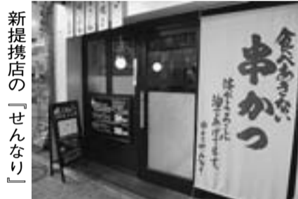
新提携店の「せんなり」

拡大の英気を養うためにこの日はあえて拡大を忘れ、楽しく過ごした一日となりました。