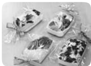
好評だった石鱈デコパージュ

「ミニ手芸」では、「石鱈デコパージュ」を作りました。なかなか好評でした。その後、分会やお仲間とやらから問合せ続出でした。終了後、主婦の会では初めて支部4役との懇談会を行いました。