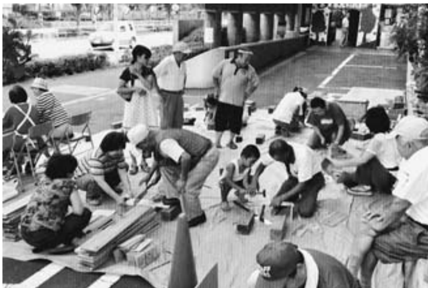
毎年恒例のわくわくまつりに今年も飯塚分会が参加