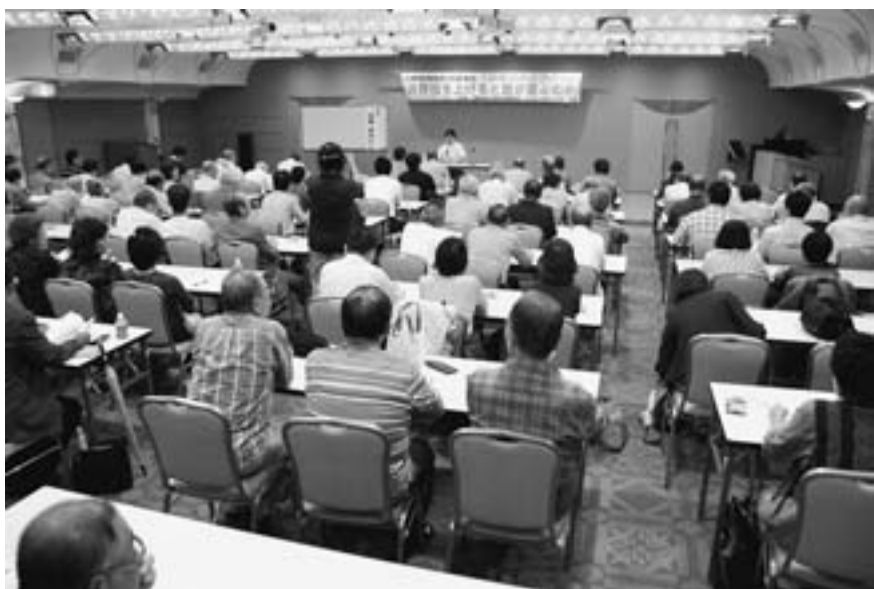
137人が集まり消費税について学びました

対象となったことが原因で消費税の何を詳しく知ることになった経緯。そして調べることで、単純に思える消費税が非常に複雑であること、消費者課税対象者でないこと。課税対象となるのは、消費者から消費税を預かった事業者であり、その事業者は、消費税を消費者から預かれない場合は、自らの腹を切らなければいけないこと（弱いものがそのツケを払われる制度であること）など、実体験を踏まえてわかりやすくお話しいただきました。