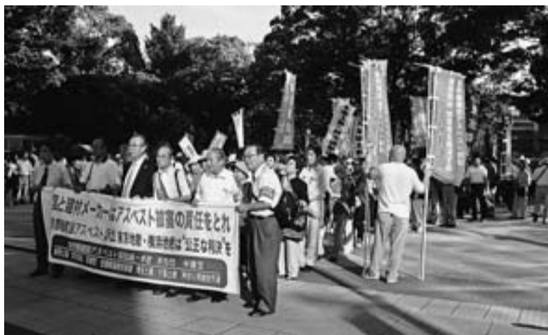
9月9日横浜地裁での支援行動

大阪泉南 賠償訴訟では逆転敗訴を受けました。人命を軽視したこの不当な判決は、今後の首都圏建設アスベスト訴訟に大きな影響を与えるものです。 今なお闘っている首都圏建設アスベスト訴訟。その支援行動を9月9日（金）横浜地裁で、9月28日（水）東京地裁で行いまし