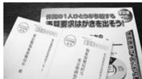
9・10月で取組む対都要請ハガキ

先月までに取組んだ厚生労働省宛の要請ハガキに続いて、今月から2012年度国保予算の都費補助金増額を実現するための対都ハガキ要請の取組みが始まりました。ハガキ要請行動は9月、10月に取組み、組合員1人1シート4枚の記入をめざします。皆さんの書いたハガキ1枚1枚は、補助金獲得に大きな影響を与えるものです。より多くの要請ハガキを送る取り組みに組合員皆さんの協力をお願いします。○目標：各分会員の200% ○第1次締切：9月26日(月) ○第2次締切：10月25日(火) 皆さんに7・8月に取組んでいたいただいた厚生労働省宛の要請ハガキは、1万1440枚(231%)を届けることができました。ご協力ありがとうございました。