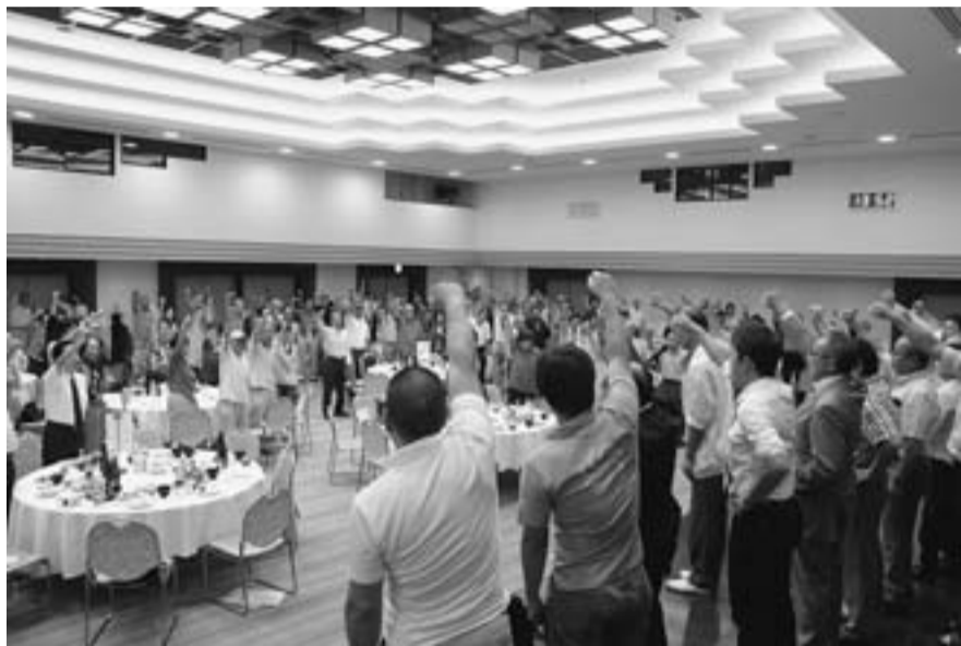
参加者全員で拡大達成に向けガンバロウ三唱