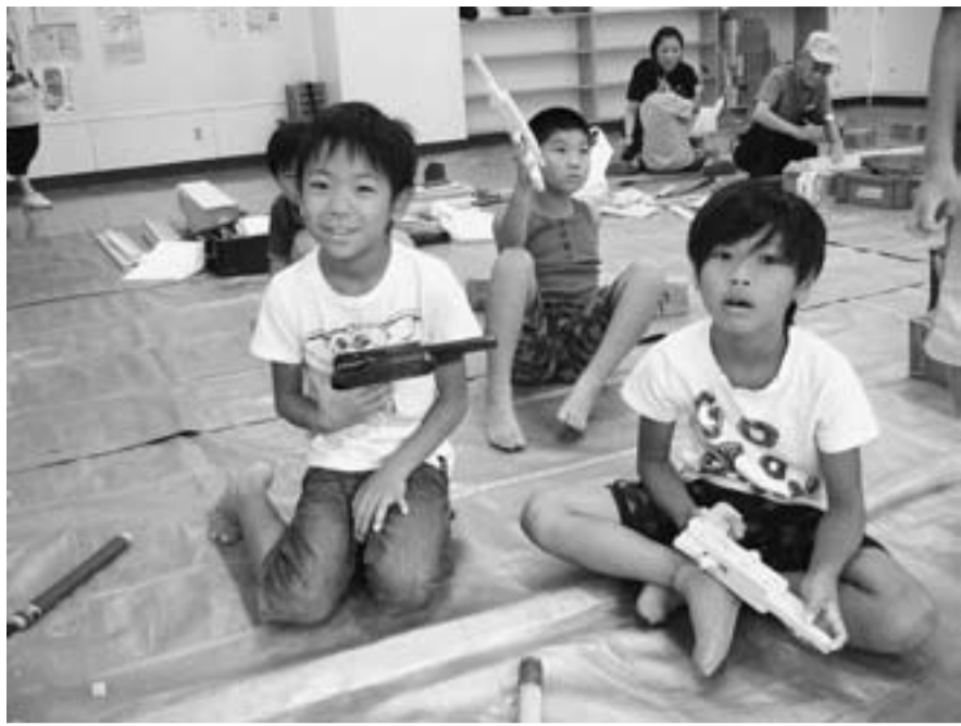
西奥戸児童館での工作教室で作った鉄砲を手に喜ぶ子どもたち(奥戸分会)

【奥戸・教宣・星谷聰】奥戸分会は7月、8月で地域の3児童館と2丁目子ども会の木工作教室を例年通りに実施、秋の南奥戸小を残すのみに。頼まれれば断れない、お人好し揃いもあるけれど、地域重視は仕事・拡大も含む地縁造りの基本と考える分会の方針なのです。 児童館は40人前後、子ども会は雨も降り、子供の参加は20人程ですが、父母と町会の役員は30人以上も一緒に作業してくれ、即日仕事や拡大に、結実するものではないが、手ごたえ十分と仲間達。屁理屈はともかく、今回はどの会場もゴム鉄砲の人氣が高く「指導の講習をしないとまずいかな」なんて。 出来上がって喜ぶ子供の笑顔を見れば、こちらまで嬉しく楽しくなりますよ。