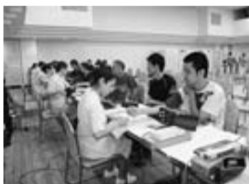
7月に開催の健康診査

今年度の健診は、もう終わりましたか。受診券のある組合員・家族の方は、心電図・胸部レントゲン検査など30項目以上の充実した健診が無料で受けられます。 日時：12月4日(日) 朝8時半～11時半