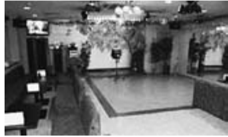
カラオケパブ あすか