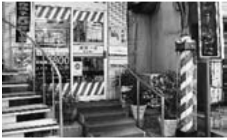
理髪一番 新小岩店