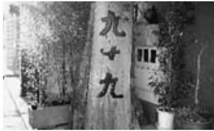
活魚・ふぐ 九十九

豊富です！ 住所：葛飾区堀切3-26-1 電話：3691-8683 特典：☆ドリンク類10%OFF 時間：午後5時～午前1時 定休日：年中無休