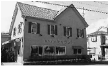
菓子工房 キャラント

特典：☆カード提示の方に5%割引いたします(他のサービスとの併用はできません) 時間：午前10時～午後7時(季節により変更あります。) 定休日：水曜日