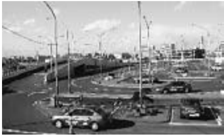
金町自動車教習所

特典：技能料金2日分割引！技能料、何回でも追加料金なし！更に学割特典あり(普通自動車免許取得者限定) 時間：☆ご予約してお申し込み下さい。 定休日：8月15～16日・12月29～1月4日