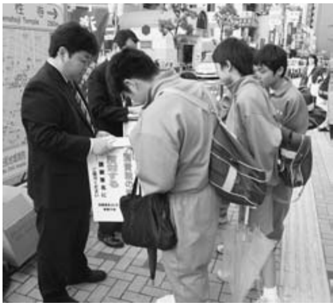
中学生も消費税増税に反対と署名