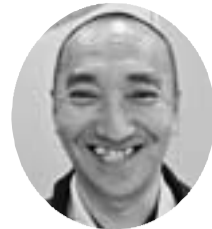
松山厚生文化部長

の達成は5分会(奥戸・立石・二葉・金町・幸田)。二葉・幸田分会は、両目標を達成しました。ご奮闘いただいた皆さんご協力ありがとうございました。また、月間が過ぎても加入はいつでも受付中です。興味のある方は、支部事務所まで。