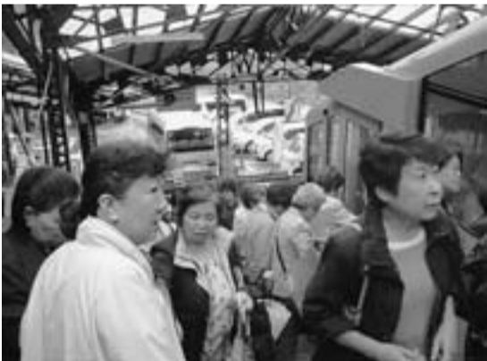
ケーブルカーで御岳山駅へ

ケーブルカーで御岳山駅へ入り。朝からの雨の中、出発したものの雨は一日中やまずトホホ…。そんな中、主婦の会の仲間61名が参加し、5月29日(日)『奥多摩・御岳バスハイク』に参加しました。 それでも仲間が集まればにぎやかで久しぶりに顔を合わせずみません。