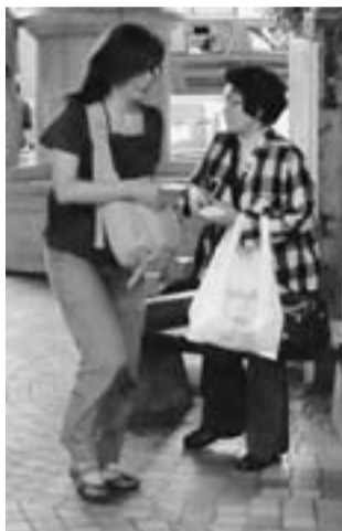
9人が青砥駅頭で訴える

5月18日(水)首都圏建設アスベスト訴訟第15回期日が東京地裁で開催されました。年内の結審を迎える予定でしたが、4月に裁判官の異動があり、結審は来春の予定と変更になりました。第15回期日では5名の証人尋問が行われ、そのうち2名が葛飾支部の組合員でした。第15回期日と同日の夕方、青砥駅にて裁判の支援行動として宣伝行動を行い、参加者は労働対策部員を中心に9名でした。今回の宣伝行動は署名活動はなくチラシ入りのティッシュの配布だけでしたが、用意した千個のティッシュは1時間あまりで配り終わり、裁判で闘っていることを周知する宣伝ができました。