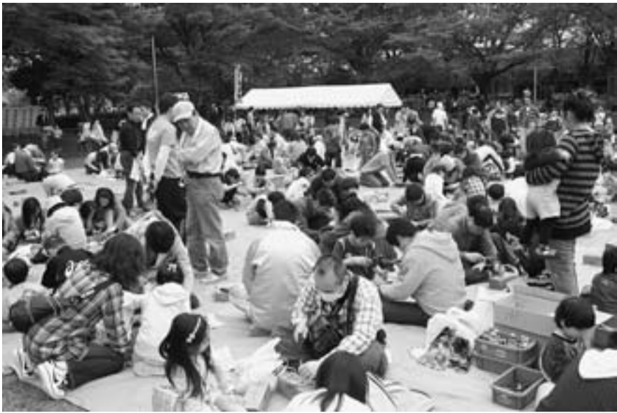
今年も多くの来場者でにぎわった新小岩ふれあいまつり