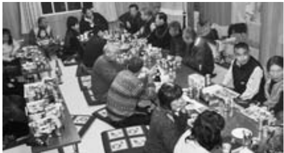
幸田分会総会後の懇親会