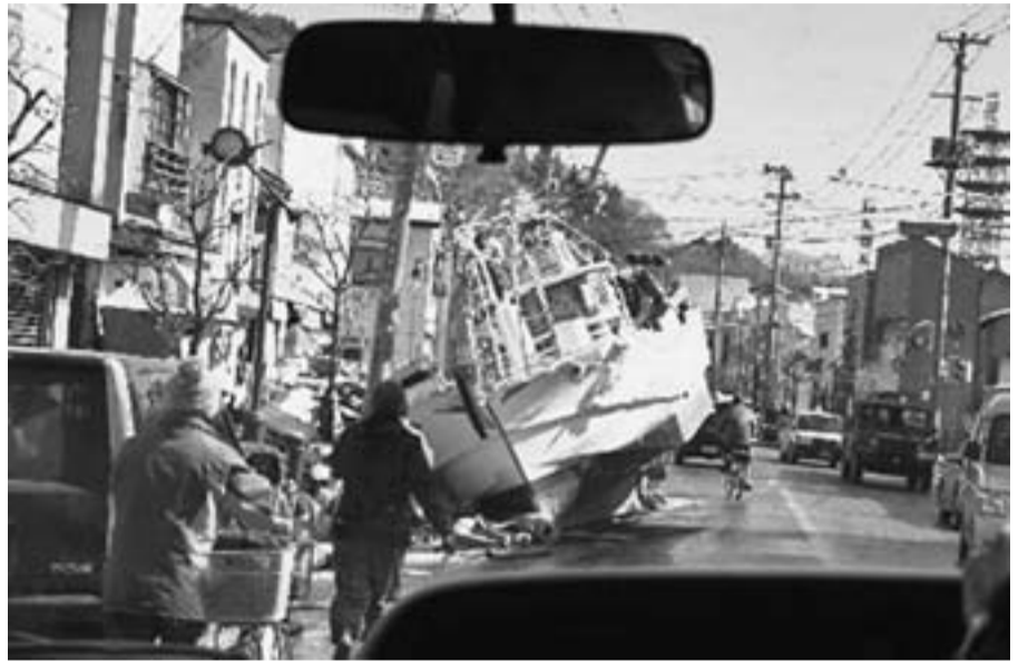
宮古市中心街には舟が流されたまま

歴史上類を見ない甚大な被害を起こした東北地方太平洋沖地震。被災された方へお見舞い申し上げます。