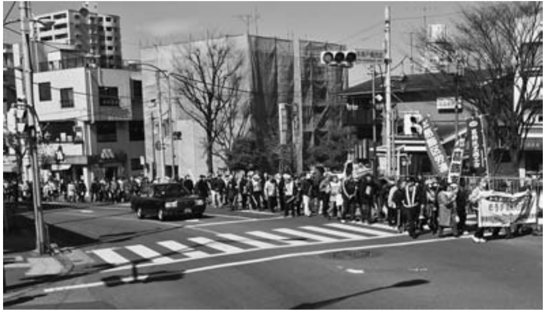
シンフォニーヒルズから奥戸橋と通って税務署までデモ行進

「落ち着いて対処しましょう」としか、現在、言いようがありません。東京土建本部は対策本部を立ち上げ、全建総連を通じて支援要請にも対応する予定です。支援カンパについては組合員、一人当たり千円で取組むとしており、分会を通じて皆さんへお願いすることになります。ご協力を願います。