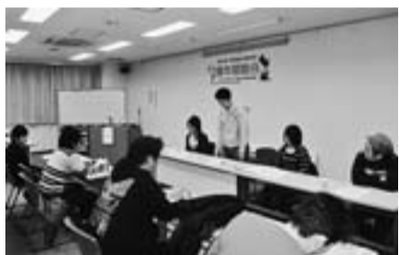
青年部総会に17人が参加

お問い合わせ 千住支店 TEL. 03-3882-3121 担当 中西・石橋 ご相談は ローンセンター TEL. 03-5813-8306 (土日営業) 中央労働金庫 http://chuo.rokin.com