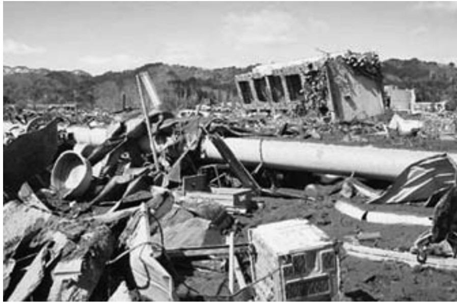
津波で破壊された宮古市津軽石地区