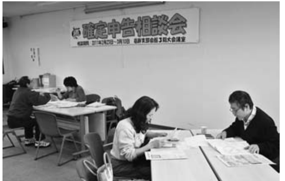
確定申告相談会で、相談に乗る柳生税対部長(右)