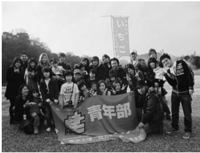
イチゴ狩りに参加しみんな笑顔で楽しみました (青年部)