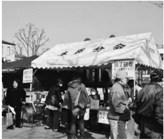
本田分会が参加の東四つ木地区センターまつり

【本田・教宣・高橋清】2月27日(日)東四つ木地区センターまつりが、晴天の中、開催。地域のみなさんが「今年もまた来たよ」と人気の包丁ときに、145人の皆さんが来られました。顔なじみの人が多くなり、包丁とき手は6人で、288丁の包丁を研ぎました。竹とんぼ工作には10人、金魚すくいにも36人の来場がありました。