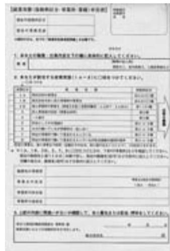
就業実態申告書の提出にご協力を

昨年7月末から取り組んでいる就業実態申告書の提出期限は今月までです。早急な解決が必要となります。3月3日現在、4426人中、4181人の提出があり、約5%の245人の方が未提出、また、提出された方の中でも、967人