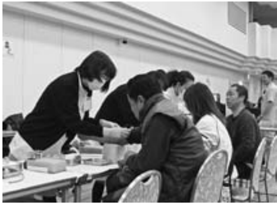
225人が受診 10年度最後の支部集団健診

この日は1階でも左官組合の方達が健診会場として使った。今年度は家族も組合員と同じ健診を受けられるようになりましたが、受診者が減少しつつあります。23年度の受診券は保険証と一体になりますので受診しやすくなります。さらに、1月より水元セツルメント診療所と、4月には佐久間医院が葛飾支部の指定医療機関になりました。1年に一度は受診し、体の総点検をして元気にくらしましょう。