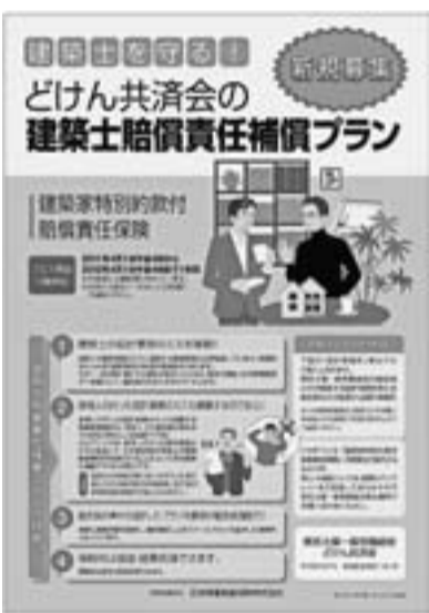
建築士賠償のパンフレット

組合員からの要望から、4月1日から建築士が対象の賠償責任保険がスタートします。この保険は、東京土建オリジナルの建築士事務所を対象としたプランです。最低保険料が年間7,000円と加入しやすい掛金も魅力のひとつです。