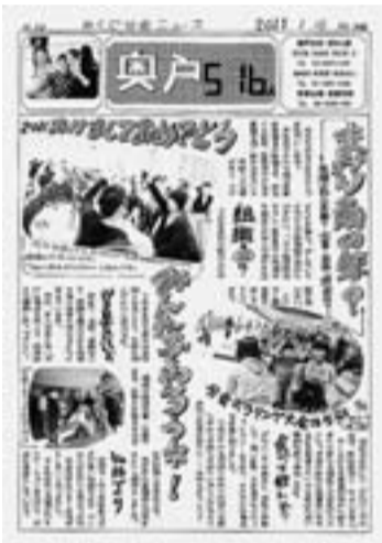
特別賞の「奥戸」新年号

○全国機関紙誌コンクール ・特別賞：奥戸 ・佳作：東新小岩・ほんでん ・佳作：東新小岩・二葉・菖蒲堀切