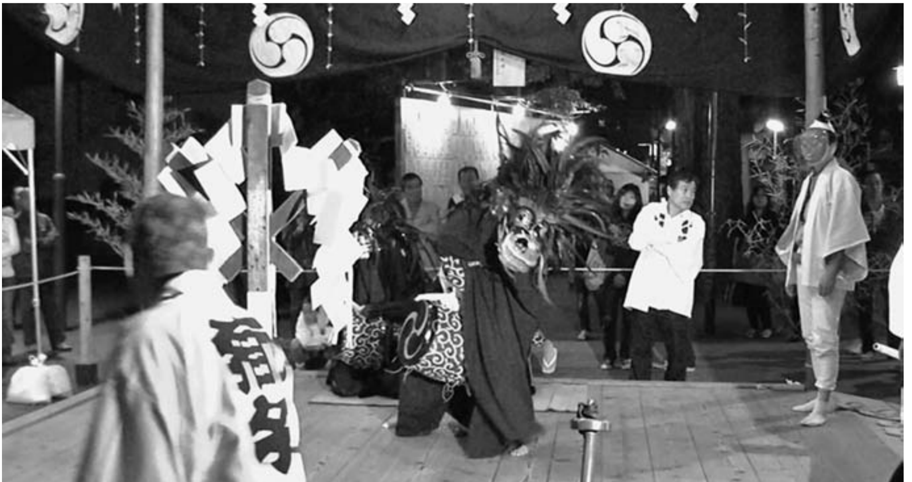
柴又八幡神社神獅子舞に使われる三匹の獅子頭（上）毎年10月に開催される『柴又八幡神社神獅子舞』