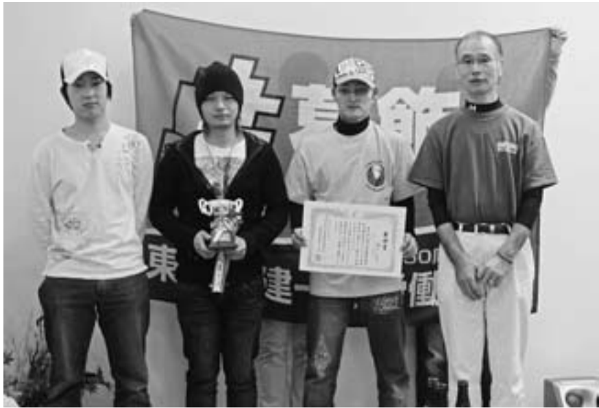
葛飾支部予選会を勝ち抜いた奥戸分会にみなさん