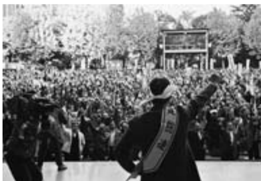
みなさんにご協力いただいた要請ハガキ(上) 夏・冬と予算要求の集会を開催(下)