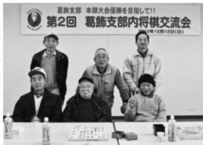
充実・満足の支部内将棋大会でした