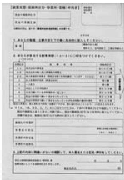
就業実態申告書の提出を

昨年7月末から取り組んでいる就業実態申告書の提出されていない方は、提出をお願いします。土建国保に加入されている方全員の取り組みです。