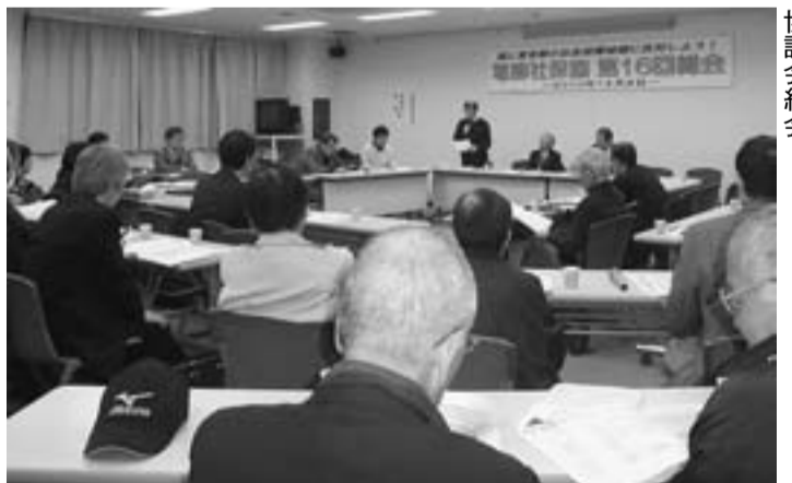
21団体が参加した葛飾社会保障推進協議会総会

裁判の期日と同一日の夕方、青砥駅頭にて署名行動を行いました。参加者は労働対策部員、原告役員を中心に11人。宣伝用のマイクの声に立ち止まって耳を傾け、がんばって下さいと署名を書いてくれた方もいました。署名は合計で47筆でした。参加したみなさんお疲れさまでした。