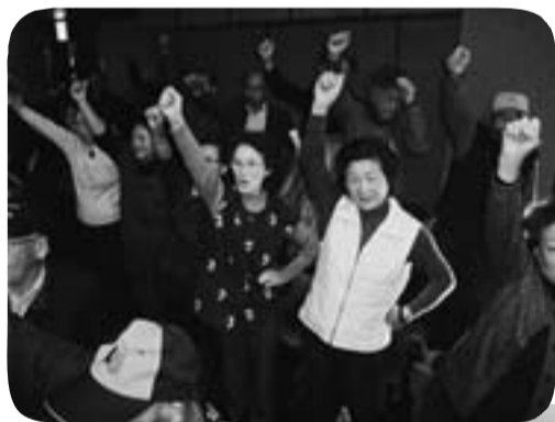
要請行動に参加した葛飾代表のみなさん(上) 星陵会館を満員に埋め尽くした仲間(下)