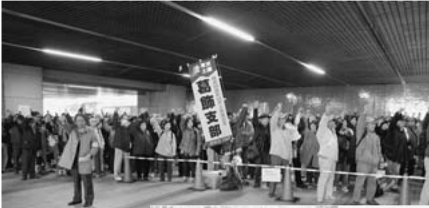
都庁前での午前の集会 (左上)