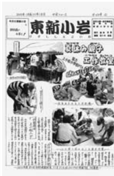
入賞の『東新小岩』分会新聞8月号