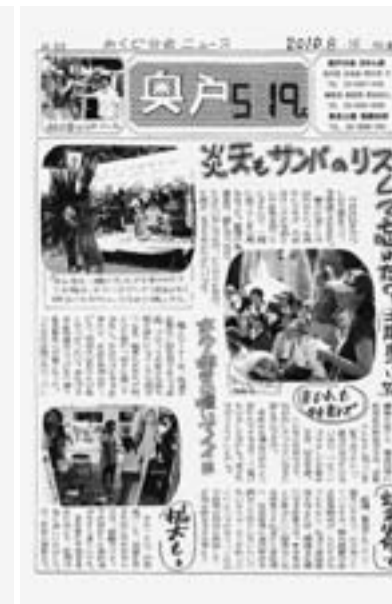
特選の『奥戸』分会新聞8月号