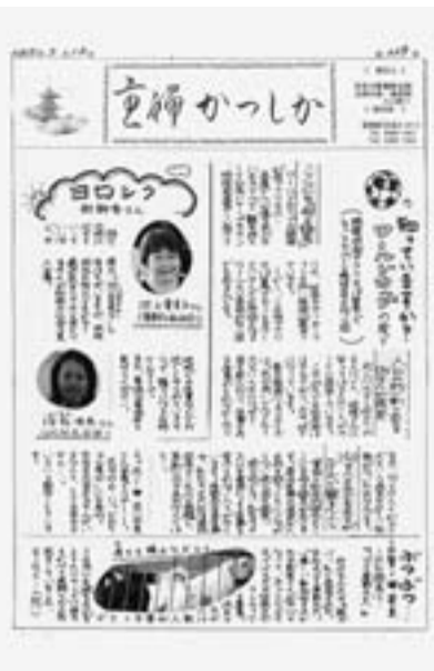
入賞の『主婦かつしか』主婦の会新聞7月号

で行いました。結果、応募総数242紙の中から葛飾支部から応募の『奥戸』『東新小岩』『主婦かつしか』が入賞しました。