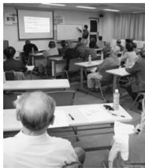
恒例となっている建長会健康教室

の職員でギコギコ、トントントンの職員でギコギコ、トントントン。毎回参加する子が「オレ、剣を作りたい。」「それなら、もう自分で好きに作りな、見ていてあげるから。」