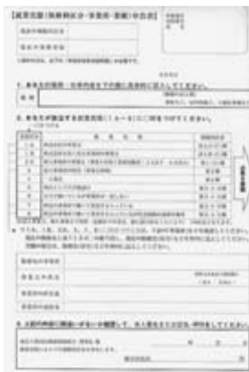
申告書の提出済みでしたか?

就業実態申告書は、済んでいますか? 土建国保に加入されている方全員の取り組みです。12月3日現在、4426人中、3680人の提出があり、約16%の746人の方が未提出です。皆さんのご協力です。8割以上の方の提出がされています。まだ提出されていない方は、申告書の記入と添付書類(建設業従事者の証明)をそえてご提出をお願いします。不明な点は支部事務所までご連絡ください。