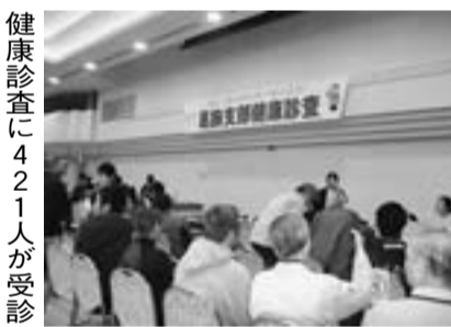
健康診査に421人が受診

けん火災共済の加入5件と自動車共済の見積り5台を見事にやりきりました。 ☆自動車共済見積り達成分会 ：高砂・金町・幸田分会 ☆どけん火災共済達成分会： 西新小岩・堀切・高砂・金町分会