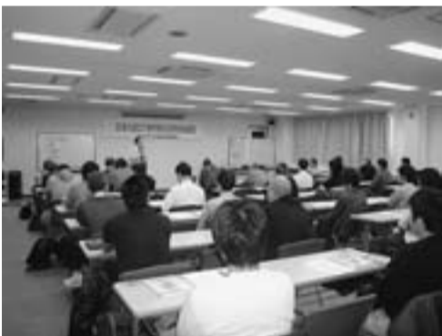
2日間にわたった足場の講習

3階大会議室で、『足場の組立て等作業主任者技能講習』を受講者35人で開催しました。