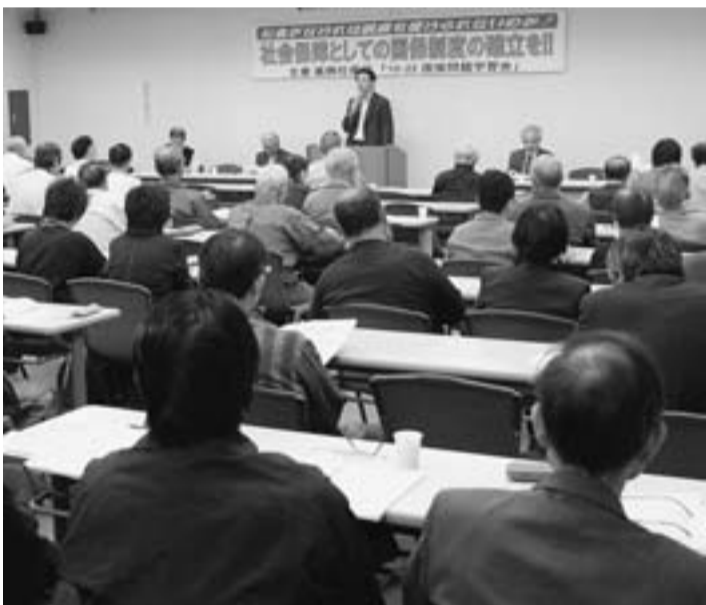
国保問題学習会に17団体79人が参加