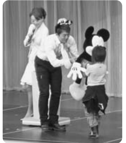
景品のプレゼントをする千葉後継者対策部長

「キャラクター・ミーがSEIBU」 普通の入場じゃ味わえない もちろん拡大の訴えも