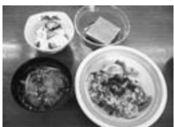
出来上がりのパエリア

10月4日（土）亀有会場に23人が参加して、ヘルシークッキングを開催しました。おそろおそろ、講義のあと調理開始。仕上がりはなかなかで