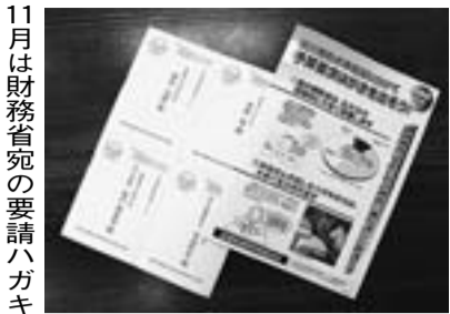
11月は財務省宛の要請ハガキ

ありがとうございます。今月は、財務省に向けたハガキ要請の取り組みがあります。皆さんご協力を改めてお願いします。