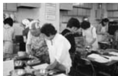
23人が参加した亀有会場

した。材料の下ごしらえと火加減さえ気をつければ問題なし。レシピあります。ぜひ挑戦してみてください。 毎年4会場でおこなう「ルシークッキング」。すっかり主婦の会の秋の年間行事に。10月24日（日）には、残りの3会場（新小岩・ウイメンズ・パール・水元）で開催しました。今年も新小岩会場には健保組合から見学も…。