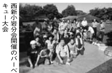
西新小岩分会開催のバーベキュー大会

65年前に日本が戦争をしてきたことを知らない人が多くなりました。それだけ平和が続いたのは、憲法9条（戦争は放棄する）を大切に守ってきた国民の力だったと思ひ、平和が一番！と実感した1日でした。