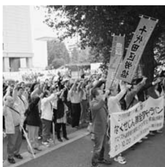
じん肺被害の根絶を訴える参加者

東京都最低賃金は、都内で労働者を使用するすべての事業場及び、同事業場で働くすべての労働者に適用されます。同最低賃金額以上の賃金を支払わない使用者は最低賃金法第4条違反として罰則の対象となります。