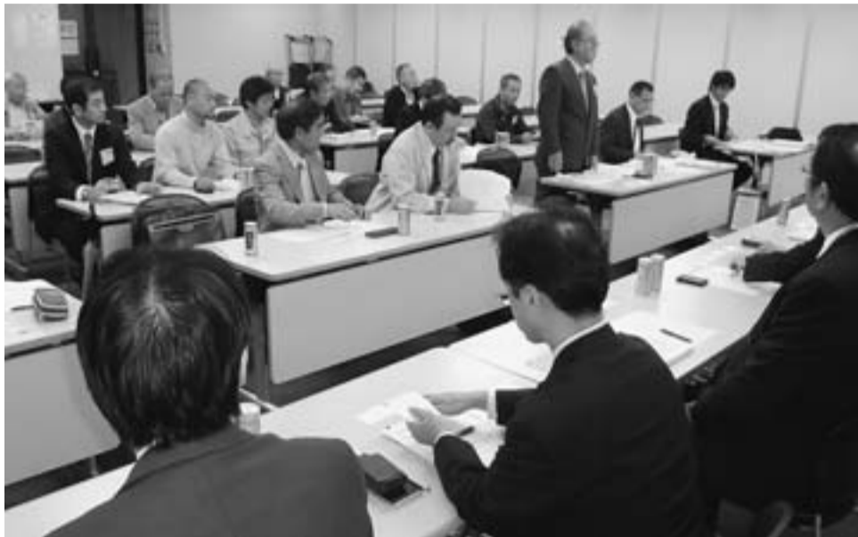
長谷工との交渉に臨む交渉団

現在建設業を取り巻く情勢は、厳しく、建設業従事者数が、今年3月時点で489万人と33年ぶりに500万人を下回る中、現場労働者の賃金下落にも歯止めがかけられない現状。また、賃金・労働条件など職場環境の悪化による若年層の入職者の減少（建設従事者の高齢化の進展）と技能労働者数の不足が推測される将来。今、対策を早急にしなければいけない状況にまで大きな問題となっています。