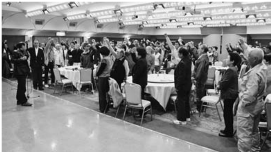
11月1日シンフォニーヒルズ別館レインボウホールで拡大打上式。137人が参加。