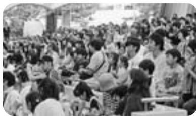
500人の参加者でにぎわう

今回は昨年と比べると、抽選会の商品の当選本数を増やすなど、たくさんの方の参加に喜んでもらえるよう、準備をしてみました。後日、参加した組合員さんから、3等の商品が当たり、ステージで賞品がもらえたことのお礼や、園内クイズの問題が難しかったこと、今回のイベントに限らず、支部の開催する今後のイベントについての問い合わせなど、多くの感想や意見を聞くことが出来ました。 葛飾支部では今回のデイズニールイベントに限らず、様々なイベントを行っていますので、お気軽に問い合わせしてください。