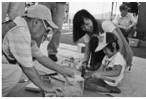
東新小岩分会が参加した地区センターまつり

開始直後の来場者は少なかつたのですが、昼ごろから、どつと来て、3時の終了時間まで指導に追われるほど盛況ぶり。