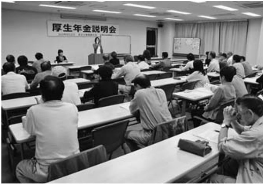
厚生年金について説明会を開催