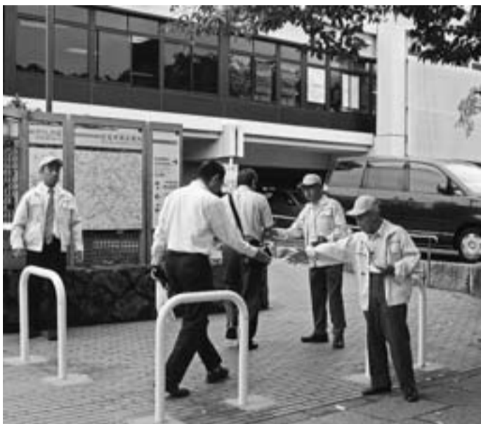
区役所前でティッシュを配る賃対部のみなさん