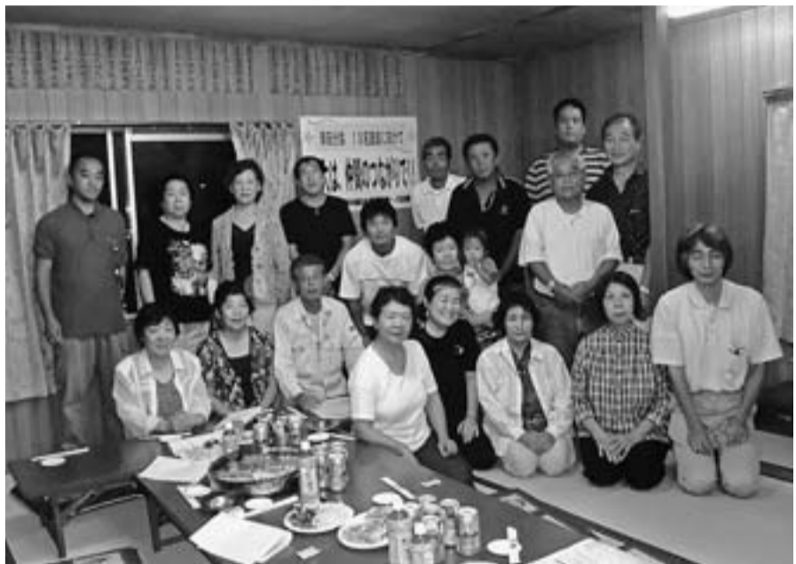
秋の拡大目標・年間実増達成に向け団結の幸田分会