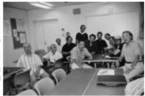
拡大と実増に向け好調の本田分会

困難な状況 今こそ拡大に力を 皆さんの協力で集めた5月の賃金実態調査。大きく下がっている現状が判明しました ○職人の賃金：前年比マイナス5.9円(1万5577円) ○職人の手間賃金：前年比マイナス51.4円(1万6180円) このような生活に直結する賃金の下落傾向。さらには、土建国保をめぐる補助金や就業実態調査の取り組み。厳しい状況下でこそ、今行っている拡大し、組織を増やす取り組みは、重要なものとなります。現在の困難な情勢を押し返すためにも組織の減少は許されません。 皆さんの知り合いの未加入の建設業で働いている方を紹介してください。その一つの行動が、組織を大きくする第一歩となり、その第一歩が大きな前進になります。