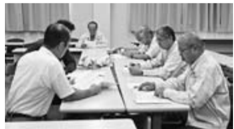
現場訪問に向けた打ち合わせ