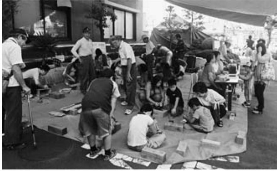
水元わくわくまつりで工作教室（飯塚分会）

最終的には、昨年より来場者が多かったです。昨年のリーダーや、新たに楽しみに来場した人などの親子連れで、来場者には充実した一日となったと思います。気温も35℃と猛暑の一日、とにかく汗だくの一日でした。