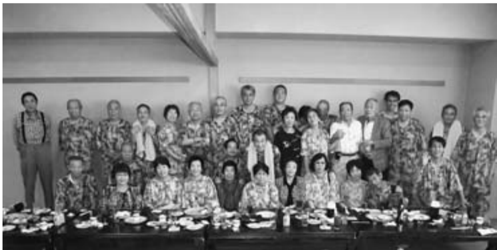
一日楽しんだ地元で開催の東新小岩分会レク