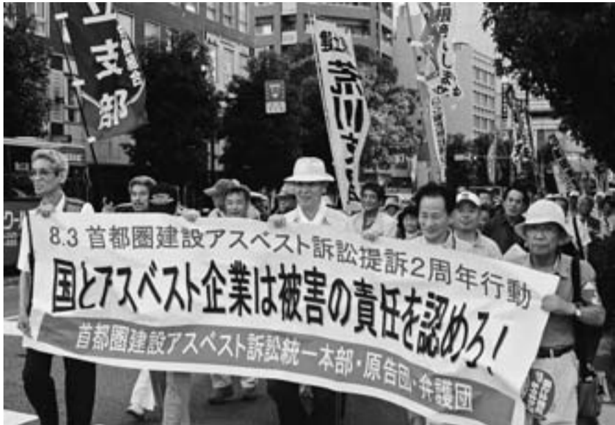
横浜関内に1200人が参加した集会

8月3日(火)、横浜関内ホールに1200人の原告・支援者が集まり、首都圏建設アスベスト訴訟2周年集会が行われました。葛飾支部からは16人が参加しました。