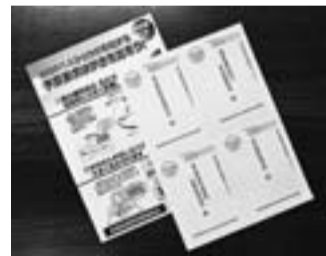
今月配布の要請ハガキ

第2部では、秋の支部拡大 秋の拡大に向けて、就業実態報告書の取り組みなど厳しい状況が続きますが、拡大達成に向けて、まずは、対象者の掘り起こしをし、拡大につなげましょう。