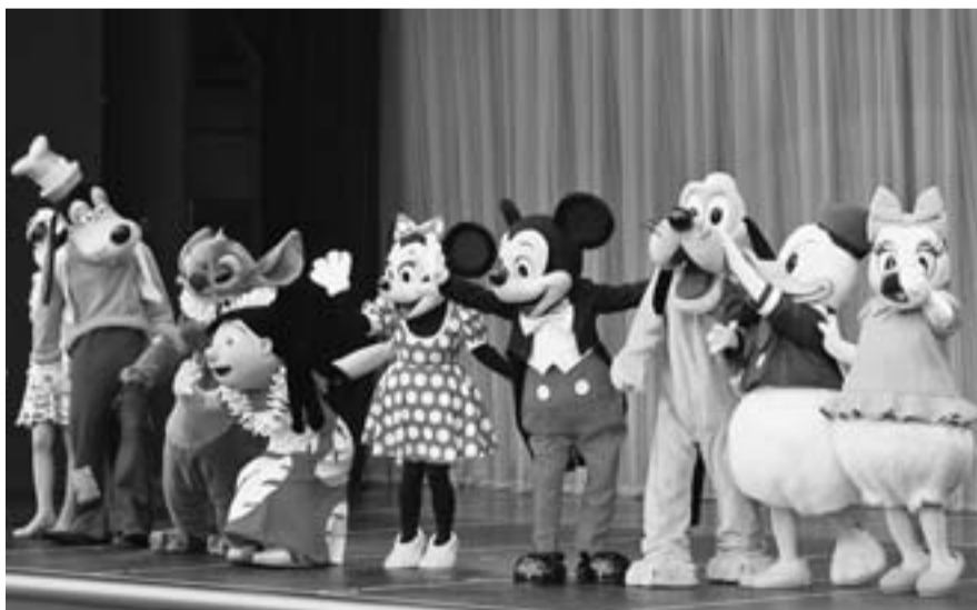
昨年の60周年記念のディズニーイベント

今年も秋の支部イベント「東京ディズニーランド『パーク・ファン・パーティー』」を行います。(申込受付は終了しています) 当日参加される方は、10月1日~12日(土・日・祝は休み)の期間が、支部事務所のチケットの受取り期間になります。必ず手続をお願いします。 昨年参加した方は、その楽しさがわかるはず。未体験の方は、楽しい時間を過ごせること間違いなし。ミッキー・ミニーマウスと一緒にふれ合おう。お楽しみ抽選会もやりますよ。 ※当日は、現地集合です。 ◆日時: 10月17日(日) 10時30分~11時 ◇場所: 東京ディズニーランドショーベース(トゥモローランド内)