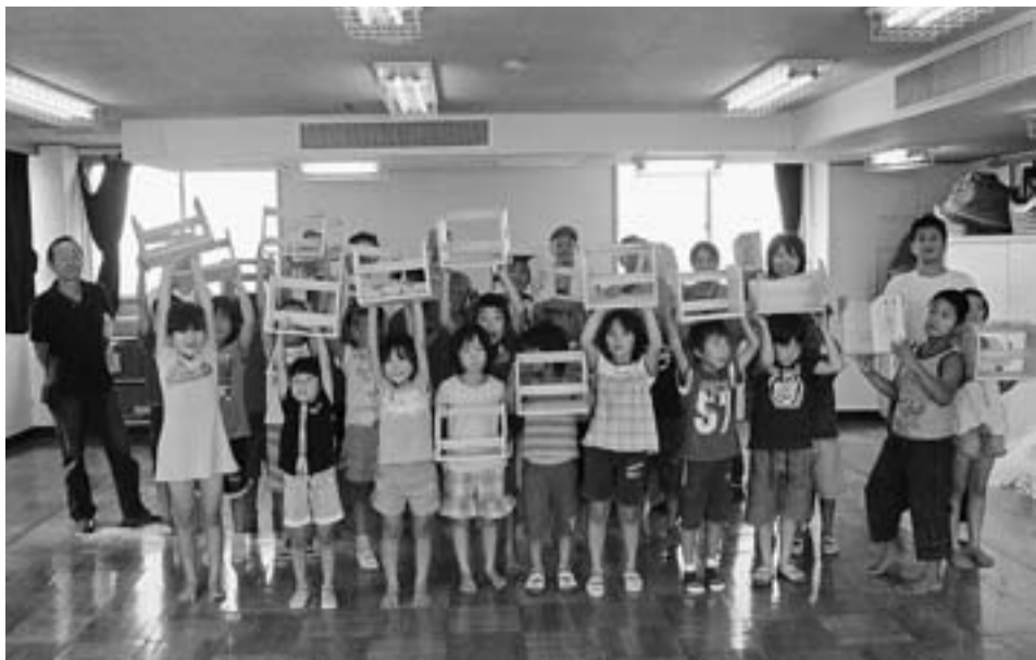
作品を完成させてみんなで記念撮影 小学生50人が参加