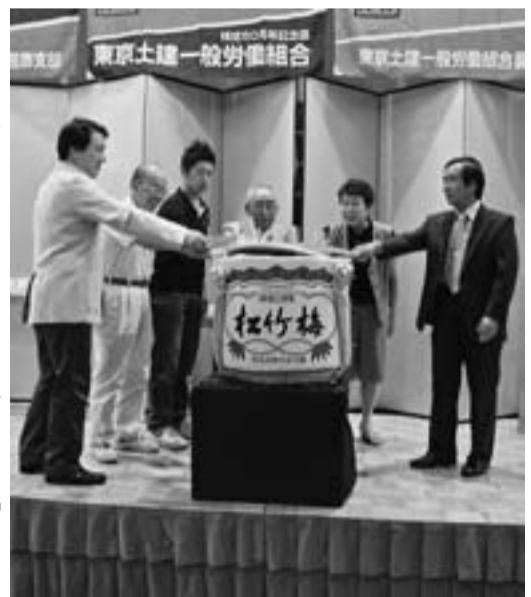
第2部の拡大出陣式での鏡びらき

300%達成分会 今度は、対都の要請ハガキを、9・10月で取り組みます。自らの土建国保を守るために、皆さんのご協力を再度お願いいたします。皆さんの一枚一枚が積み重なり、大きな力となります。この取り組みも300%が目標です。 昨今の問題で、補助金の見直しという問題があるなか、土建国保を守るためには、補助金の獲得は欠かせない運動です。必ず書いて提出をお願いします。