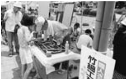
職人コーナーも人気です