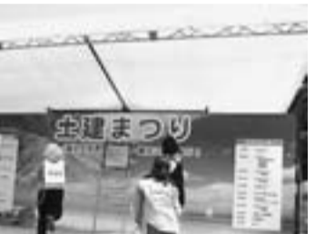
しっかりとのおなじみ『葵と楓』