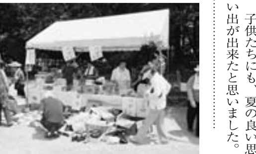
今年もキムチ買いにきました