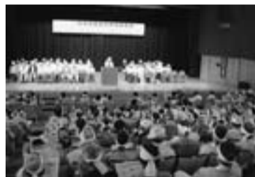
社会文化会館に集まり、決起集会を開く

【PAL葛飾】7月25日(日)首都圏の労働組合に加入し、大手ゼネコンなどの企業従事者でPALに加入する組合員たちが、「仕事よこせ、賃金あげろ、ゼネコンは利益を現場労働者にまわせ!」と初めて決起集会を永田町の社会文化会館で開きました。