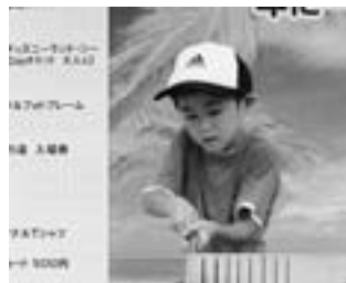
ギーコギーコ早く切れる!!