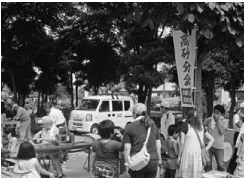
工作の受付に集まる親子連れ (8月1日・高砂団地子どもまつり) 高砂分会