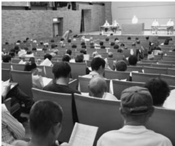
215人が参加した就業実態調査の説明会