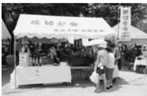
今年も展開 好評の 鮎の塩焼