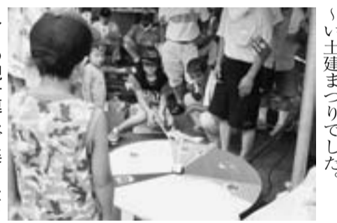
多くの親子連れが楽しんだ