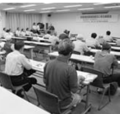
耐震補強の講習会に23人が参加

改修事に携わる方は仕事に活かすことももちろん、皆さんのご自宅も一度耐震の診断を受けてみてはいかがですか? 一般的な診断であれば、補助を受けると、12500円