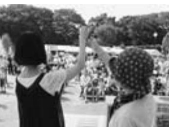
最後はやっぱり大抽選会