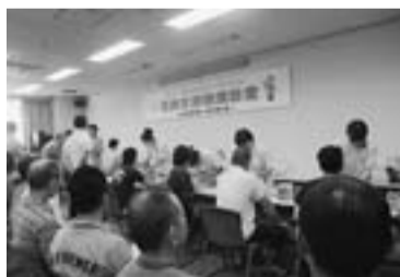
支部会館で行った健康診査

去る7月4日と11日の2週にわたり10年度支部健康診査が葛飾支部会館で朝8時半から正午まで行われました。 受診者は両日合わせて526人。支部会館3階の健診会場まで階段を上り一息ついて問診です。血圧検査・心電図・聴力などの検査を順調な流れの中で受けて1階へ。胸部レントゲン撮影をして全検