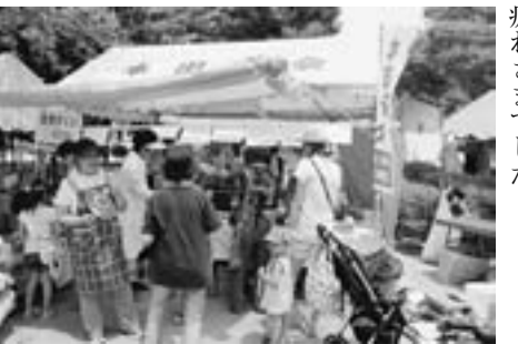
焼き鳥好評 リピーターも