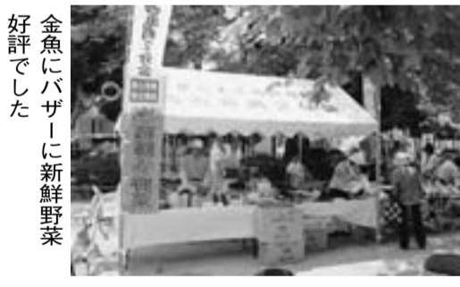
金魚にバザーに新鮮野菜好評でした