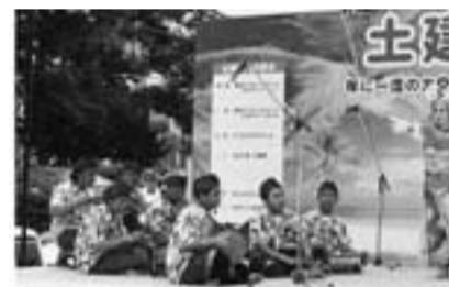
バリ舞踊 今年は国際色が豊か?!