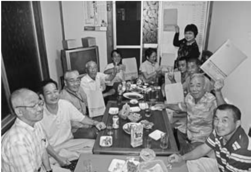
好調に拡大を進める東新小岩分会の分会拡大出陣式