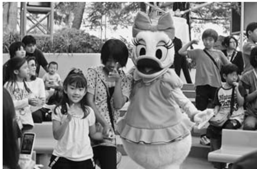
デイジーと一緒に写真撮影