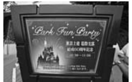
会場入り口の案内