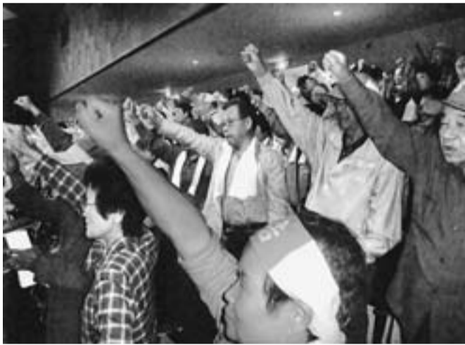
代表で参加した葛飾の仲間