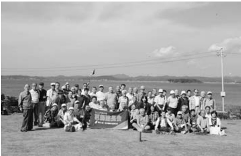
野島崎灯台で記念撮影をする建長会の会員のみなさん

65歳以上の組合員さんなら男女問わず建長会会員になれます。ぜひ会員になって建長会の楽しい行事に参加してみませんか。