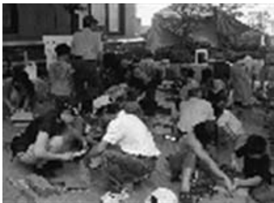
多くの来場者でにぎわう水元学び交流館(飯塚)