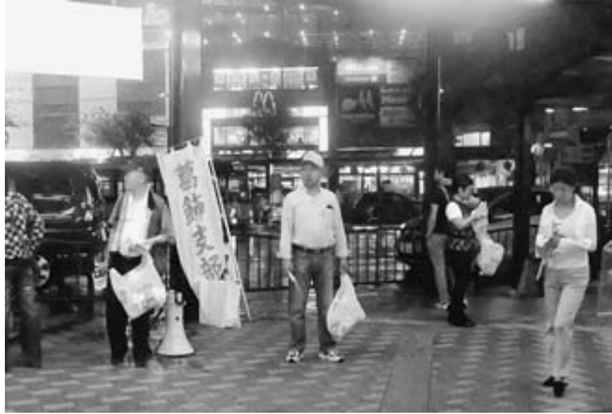
金町駅頭で通行人に訴える貸対部・PAL葛飾の部員