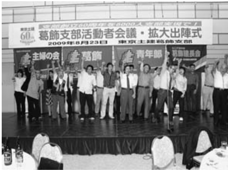
最後の壇上に上がった常任執行委員による団結ガンバロウ