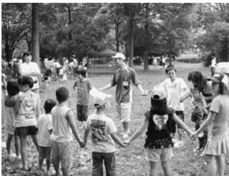
水元公園で行われたB&Q大会で子どもと一緒にゲームを楽しむ

部長のあいさつの後、さっそくB&Qをスタート。生ビールやジュースを片手に次々に焼けるお肉を、その胃袋に収めていきました。