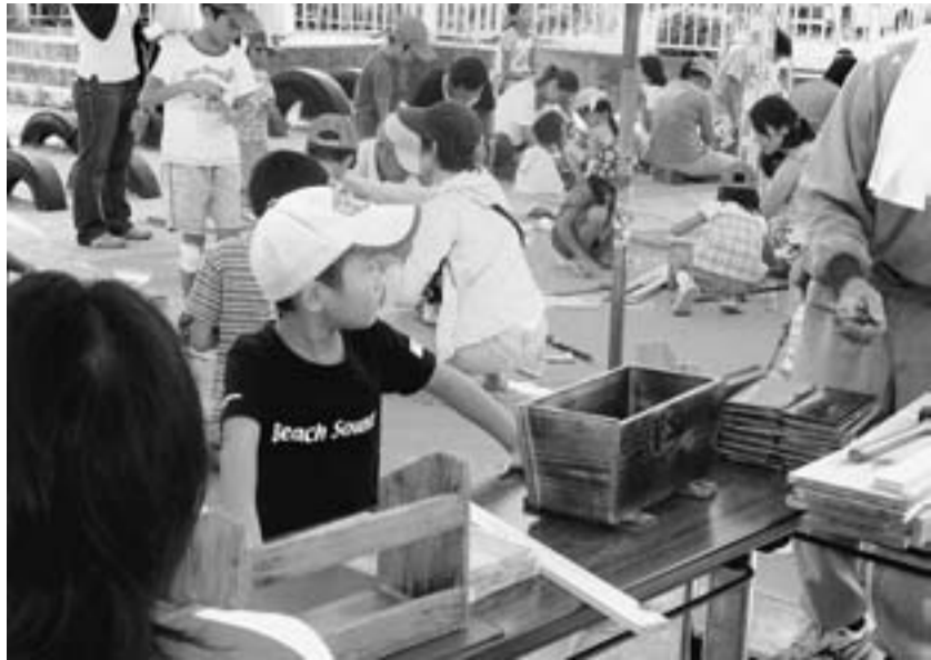
高砂地区センターまつりの工作教室 (8月29日)

夏休み本番となった8月に入って、8地域(7分会)で工作教室を開催し、地域の子どもたちに工作の素晴らしさを伝えました。