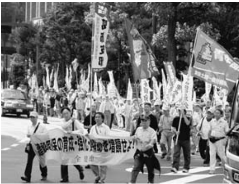
東京駅まで葛飾支部の156人がデモ行進