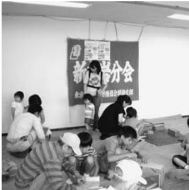
新小岩児童館で行われた工作教室(新小岩分会)