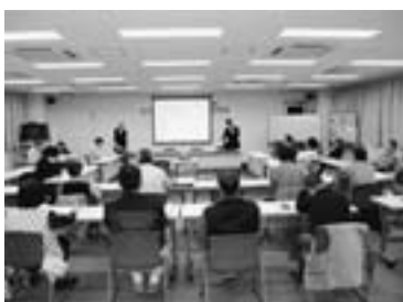
瑕疵担保保険の加入説明会

用意したのは、銅板・椅子・本立て・プランター（合計400個）。午前中から来場者の多さから、材料は、みるみるなくなり、昼休みの再開時には、50人以上の行列ができていました。そんな調子で、すぐに材料が不足しだして、午後2時には、全てなくなってしまうほど好評でした。作り終えた後に認定証を受け取って満足そうに会場を後にする子供の姿が印象的でした。一日通して、ケガ人もなく、無事一日を終えることができました。