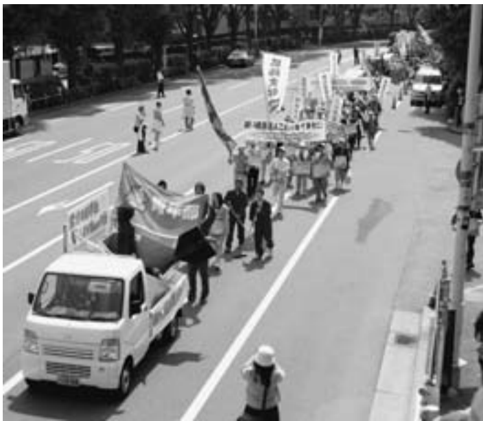
青年部を先頭に代々木公園からデモ行進

第80回ミーデーが代々木公園で開催。参加者3万6千人（葛飾支部からは225人）が参加しました。ミーデーといえば、出し物。今年も青年部が作りまくった。「兵器やいらぬものを捨てようごみ箱」。町を掃除しながら、明治公園まで、デモ行進。今年は受賞ならず。