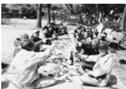
細田分会のお花見レク

自動車 5月までが月間です 見積り 新宿分会が達成・超過に 今月いっぱい車の見積り促進月間です。新宿分会はすでに達成・超過しました。入の保険証券があれば、すぐ見積り出せます。