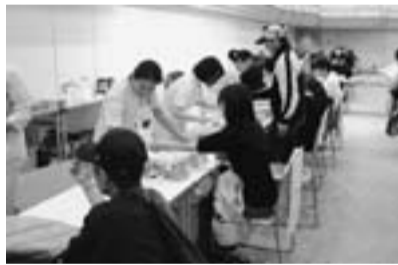
今年度最後の支部健康診査

2月24日(火)夜、小雨が降る寒空の中、青砥駅前、消費税増税反対の駅頭宣伝を行いました。税対部が対応し、3協力団体を含む21人の参加者で行いました。積極的に署名をしてくれた中学生や、帰宅で急ぎ足の中ティッシュやチラシを受け取る人など、関心の高さをうかがえる駅頭宣伝でした。税対部では毎月の駅頭宣伝を基本としています。3月は立石駅で行います。