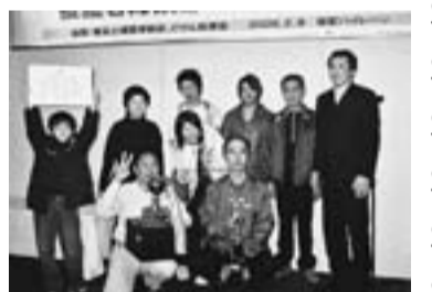
優勝を飾った奥戸分会メンバー

小雨が降る中、2008年度第3回健康診査をテクノプラザかつしかで3月1日に開催しました。294人の組合員とその家族が受診し、参加者のひとり「無料で一年に一回家族で健康状態を知るのには大切。」と喜んでいました。08年度は、受診券の再発行が多く見られましたが、来年度は保険証交換時に受診券をお渡しいたします。紛失をしないよう、気をつけてください。