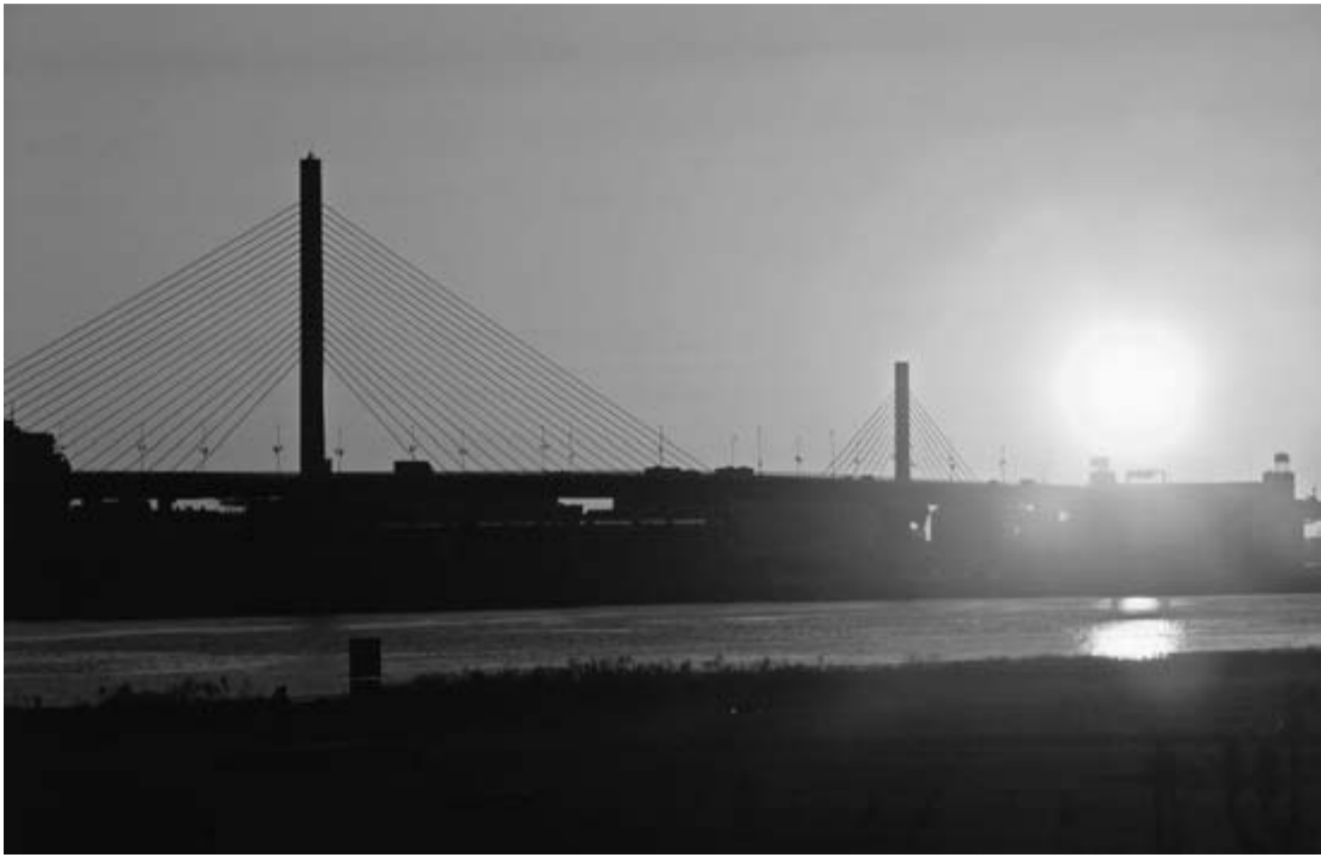
葛飾パーブ橋と初日の出

〒124-0012 葛飾区立石8-34-4 電 話 (5698) 1 2 6 1 F A X (5698) 1 2 6 2 発行人 細 貝 文 洋