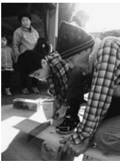
丁寧な指導で後継者育成中!?

どけん火災共済 6件超過で達成 9月から12月までのどけん 火災共済加入促進月間、葛飾 支部は、火災共済の必要性の 理解が進んだことと、ご協力 いただいた方の尽力によっ て無事達成することができま した。皆様のご協力に感謝い たします。 半分以上の19分会が達成を し、本部目標117件に対し て123件。6件目標を超過 しての達成でした。