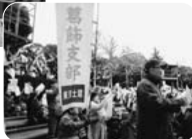
12月後期高齢者医療制度廃止集会