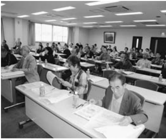
支部会館で健康教室（10月25日）