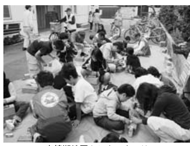
南綾瀬地区センターまつり