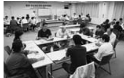
グループ発表の準備

10月11・12日に葛飾支部会館3階大会議室で、職長・安全衛生責任者教育講習を40名定員のところ、葛飾支部・近隣支部組合員の34人の受講の応募があり、2日間の講習を行いました。講義だけでなく、グループ発表を行うなど職長・安全衛生責任者教育の講習ならではの講習会でした。