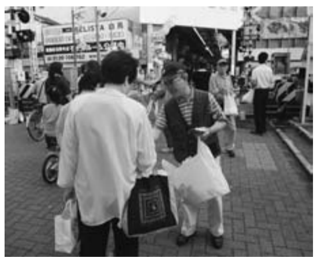
憲法守ろうと2駅頭宣伝(立石駅で)

6月27日に憲法東京共同セクター1全都一斉宣伝が行われました。葛飾支部では立石駅と亀有駅で駅頭宣伝を行い立石駅には1〜3Bから7人と