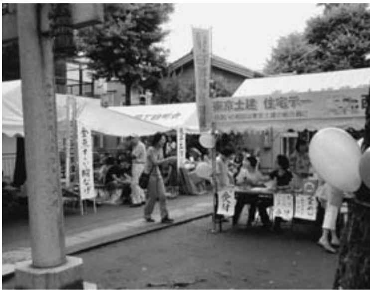
西亀有②分会 高木神社会場

第31回住宅デーは、37会場に仲間と家族748人が2650人の来場者を迎えて奮闘しました。 昨年より4会場少ない、集中した催しでイベント型にシフトした取組みは、事前宣伝で13万枚のチラシの新聞折込に加え、分会ごとのチラシ4万枚を配布し、1000枚のポスターを貼出して当日をむかえました。曇り空からの雨を気にしながらの設営となりました。