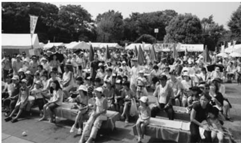
昨年の土建まつり

8月3日(日)第16回土建まつりが開催されます。 昨年は8月5日(日)に、青戸平和公園で「安心・安全の住まいづくり街づくりを住み手とともに！」とスローガンを掲げ、開催されました。当日は晴天にも恵まれ暑く大変な思いをしながらも大成功に終わることができました。 今年の第16回土建まつりも各分会・主婦の会・建長会の出店、職人コーナー、親子工作コーナーと20をこえるテントを展開し、ステージ上では、楽しいイベントも企画する予定です。皆さん、力をあわせて、成功させましょう。