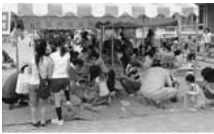
みなおくフェスタ会場

22日の住宅デーの雨対策の方針通り15張りのテントを濡らしてしまつた奥戸分会。28日に地元の南奥戸小学校50周年事業の一つ『みなおくフェスタ』で工作教室を担当「全