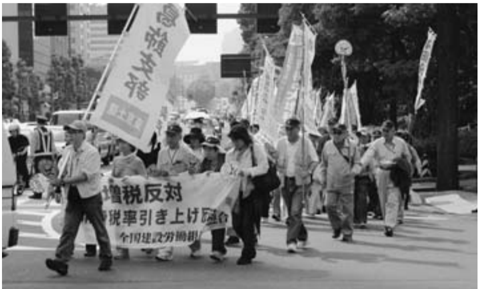
増税反対と声をあげる仲間たち(6月6日)

2丁目の焼きそば売店にも4人の仲間が働いていて、『地元奥戸分会』を800人の来場者に、しっかりとアピールできました。