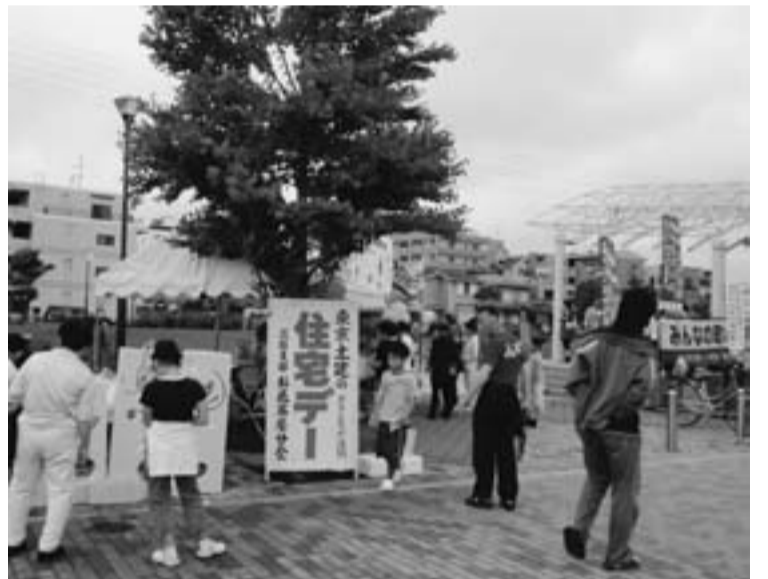
お花茶屋分会 曳舟川親水公園広場会場

それでも18会場で37件の住宅相談があり、外壁補修、床張替、下水管修理、風呂・トイレの修繕などに加え、増築や築20年のリフォームや耐震補強など真剣な相談がありました。