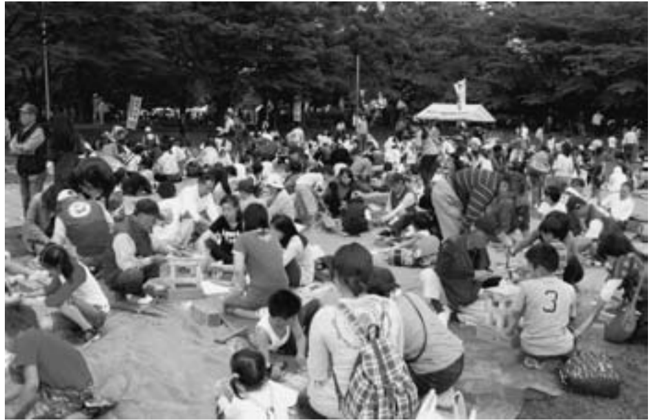
新小岩まつりのいまや中心的イベントとなった工作教室（5月4日）