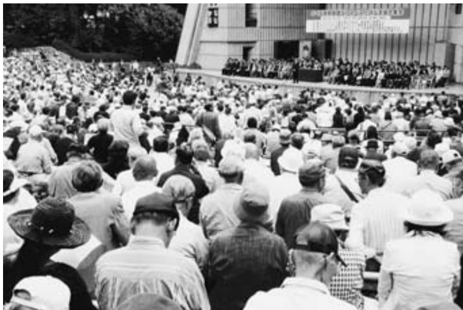
怒りと勝利への決意が会場をおおった支援集会(5月16日)