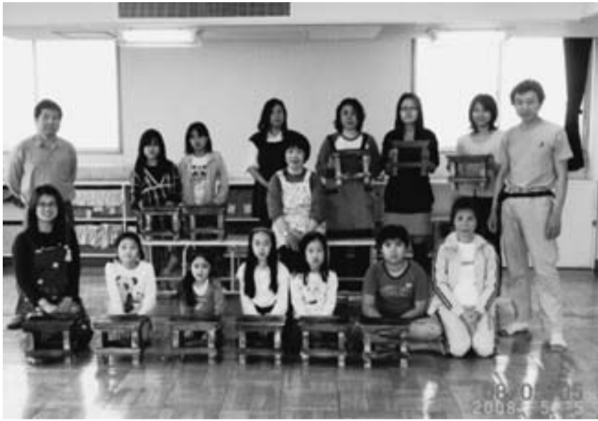
2回目となった堀切児童館の工作教室（5月5日）

今回の工作を知った東堀切児童館からも二葉分会に要請があり、時期を相談しています。