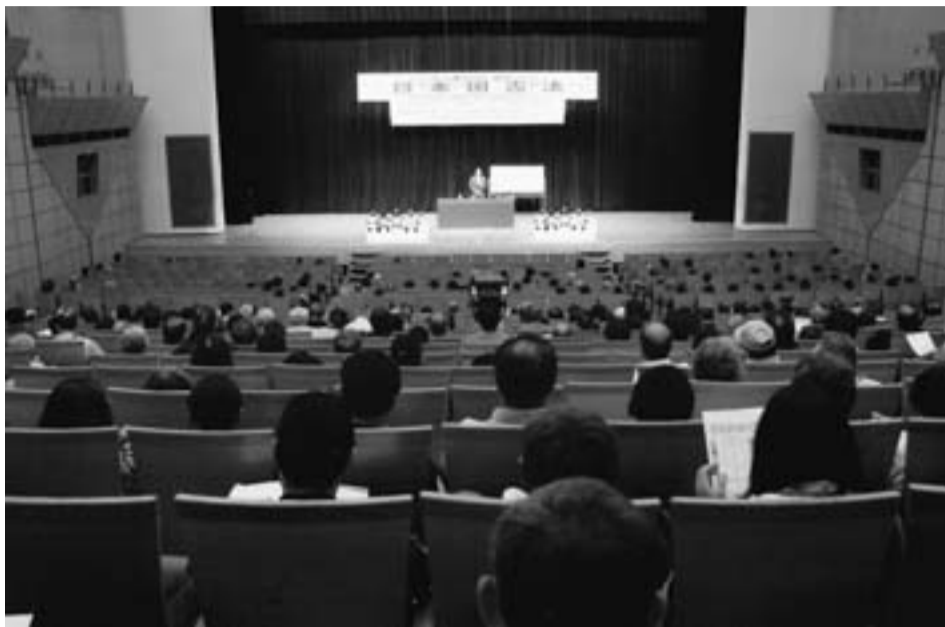
多彩な企画で開いた憲法の夕べ（4月22日シンフォニー大ホール）