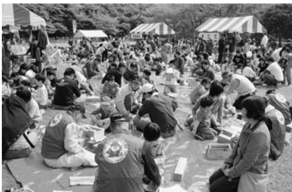
そろいのチョッキで指導に休みはありません（4月27日水元公園）