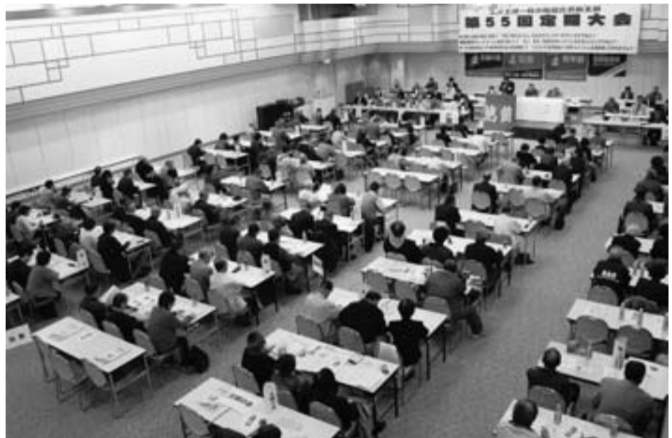
団結と自信と笑顔の第55回大会（4月13日テクノ）