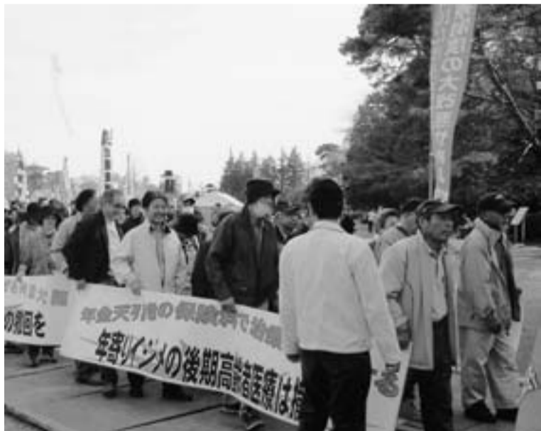
井の頭公園に12000人が参加した集会(3月30日)

3月30日井の頭公園に1万 2千人が参加して「後期高齢 者医療制度実施の中止と撤回 を求める集会が開かれ、支部 から83人が参加しました。 「年金から天引き」「保険 料引いたら暮せない」「老人