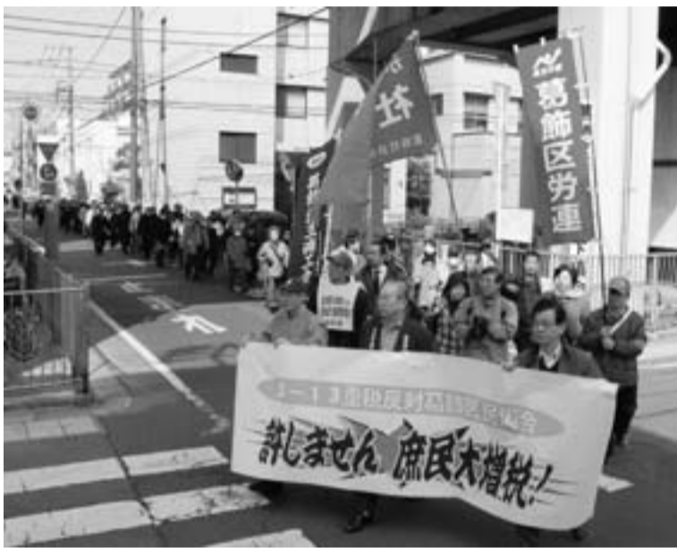
大増税計画に反対!の申告デモ行進(3月13日)