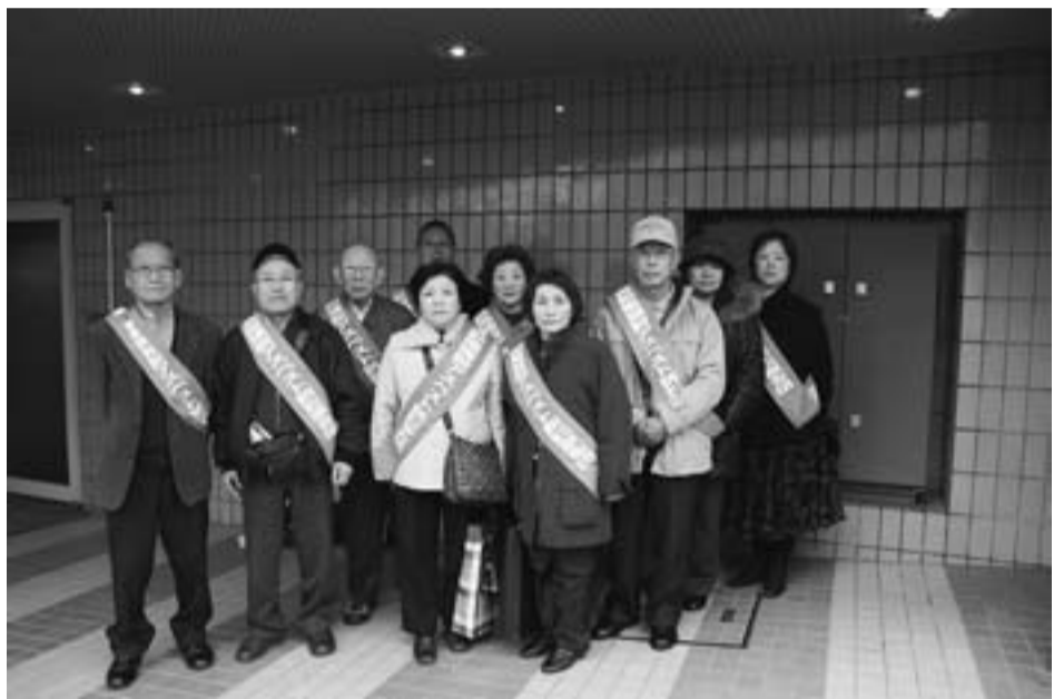
原告団結成に参加した葛飾支部の仲間の皆さん（3月2日）