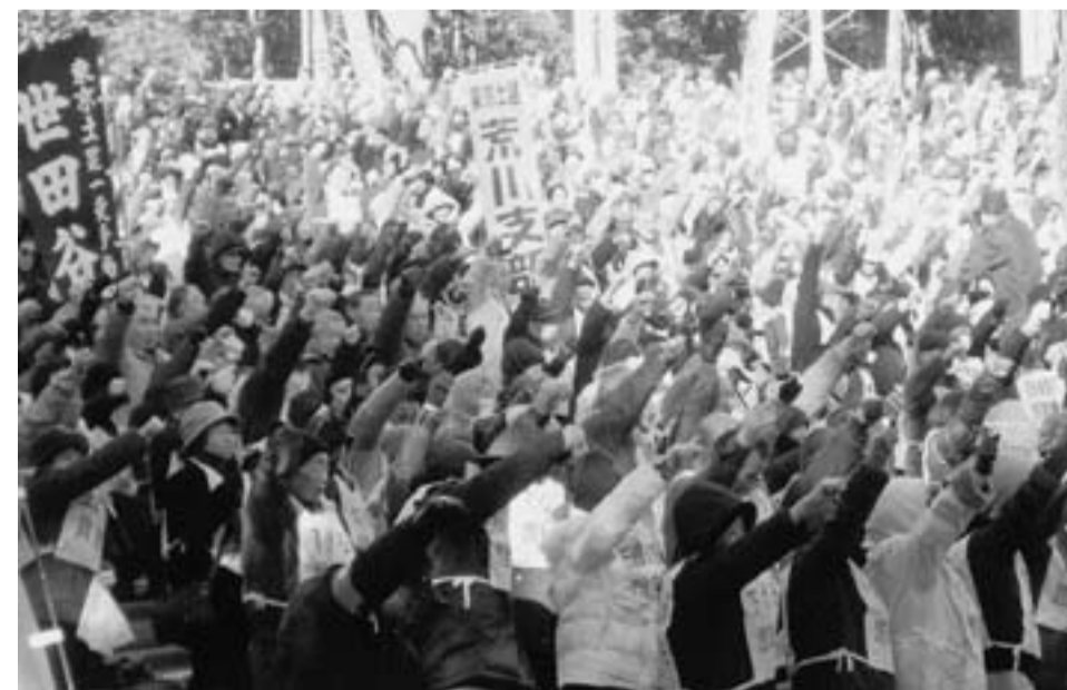
2・13首都圏建設集会で氣勢をあげるなかまたち（日比谷野音）

が始まりました。 147人の目標に3月3日現在71人で、青戸、二葉、金町東金町分会が達成し、東新