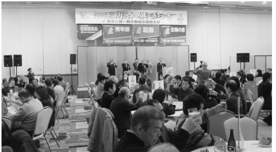
ブロック代表支部と共に乾杯する分会仲間 (1月13日ホテルラングウッド)