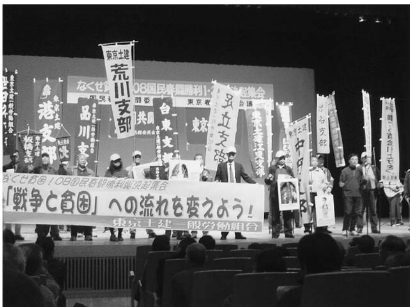
900人が参加した春闘集会(中野ゼロホールで)

にシンポジウム開催と共に原告団結成することになりました。今後もつづく被害者のためにもとまさに命がけのたたかいに立ちあがります。