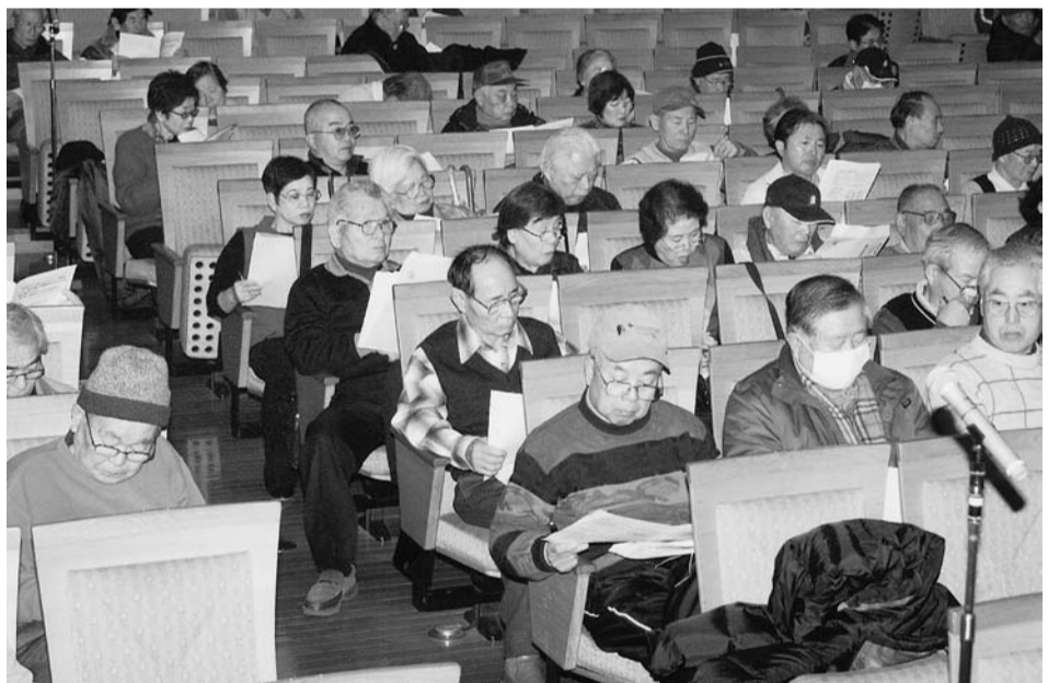
みぞれまじりの雨の中で開いた学習会 (1月23日)

今年ほととくに「達成と実増」の両目標を明らかにした取り組みです。すでに2月初旬で16分会44人が加入し昨年を上回っています。2月20日(水・木)が統一行動ですヨ、ガンバリ!