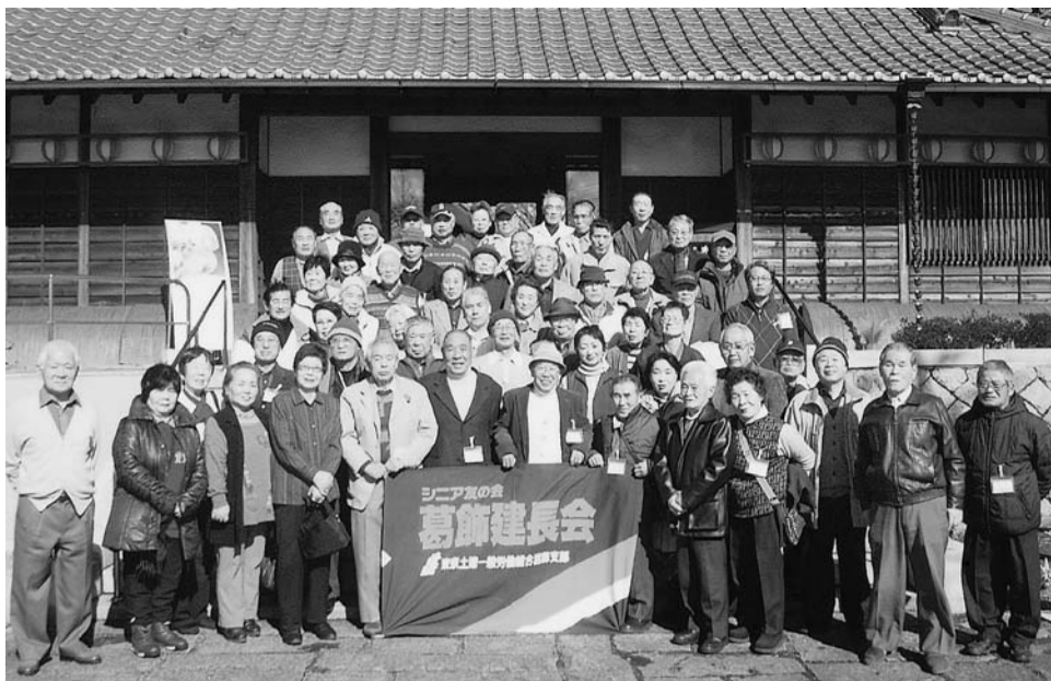
後期高齢者医療のミニ学習もした建長会の新年会