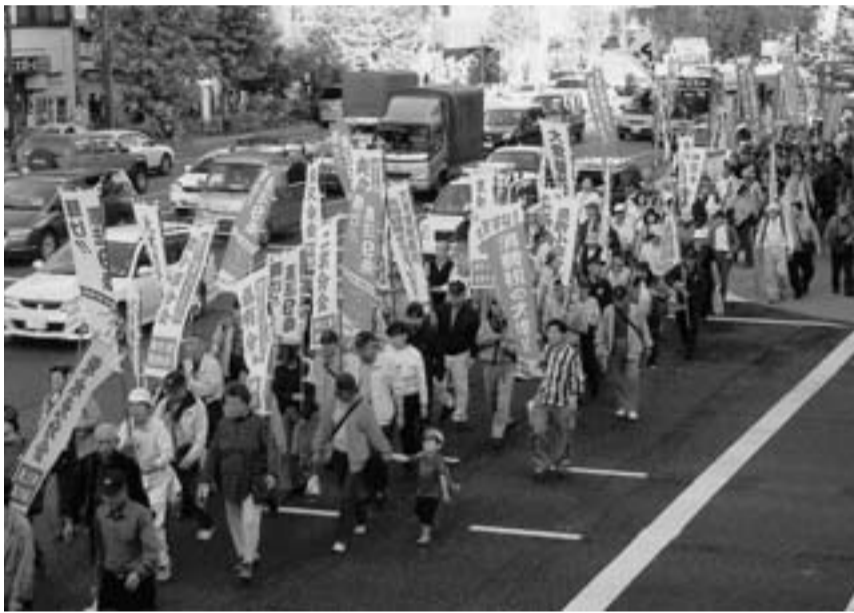
4万2千人の参加者は3コースに分れデモ行進(10月28日)

「新テロ特措法案阻止、ス トップ改憲!許すな消費税増税!なくせ貧困!いのちとくらし・雇用を守れ!」を掲げて国民大集会が開かれ、支部から90人が参加し、宣伝カーを先頭に錦糸町までデモ行進しました。秋晴れに恵まれた亀戸中央公園には、全国からつめかけ