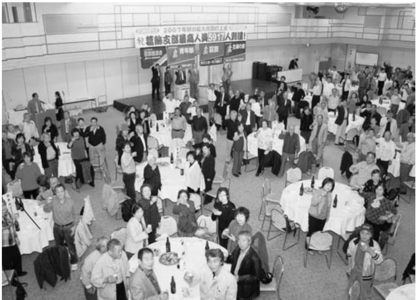
カンパニー!!190人が出席しお互いの健闘をたたえあった打上式(11月1日テクノ)