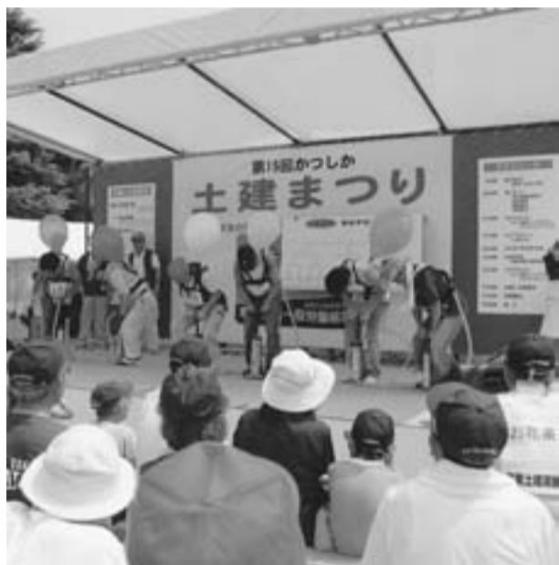
分会対抗フーセン早割り競争

8月5日青戸平和公園に2500人が来場して実施。猛暑の中でしたがまずは無事終了となりました。