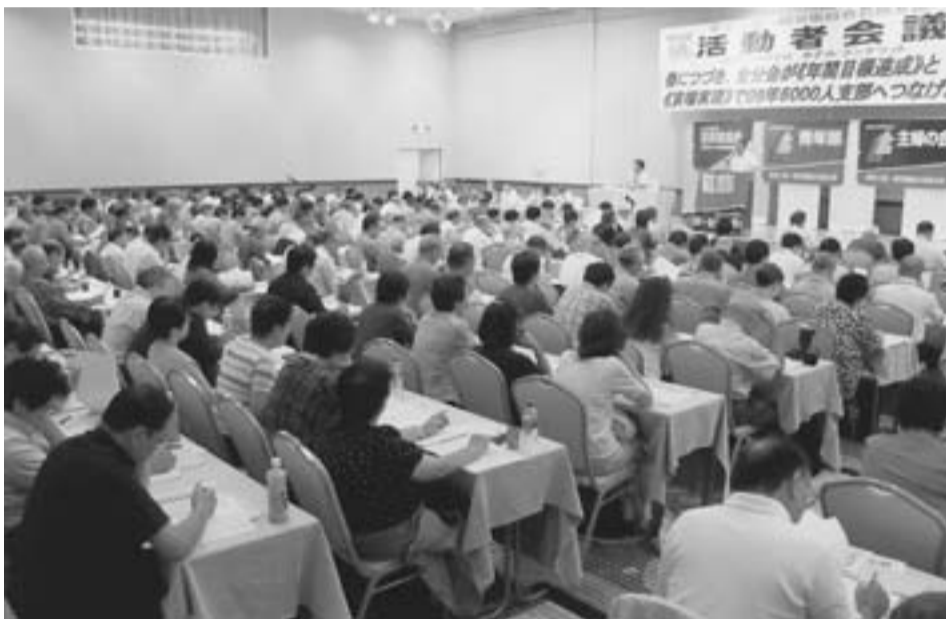
250人が出席した活動者会議（9月2日ホテルラングウッド）