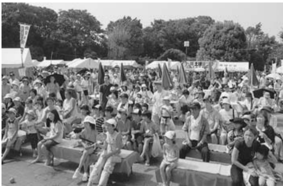
15年目を迎えた土建まつりはやっぱり猛暑でした(青戸平和公園)