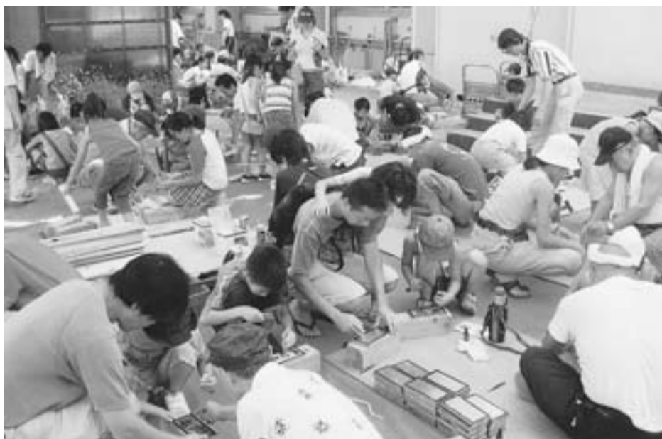
熱中症対策もバッチリの上小松小の工作教室

東新小岩分会は恒例小学校での夏休み工作教室(写真左) 猛暑のせいか例年より少なめとはいえ100人近い児童に汗だくの指導でグツタリ。