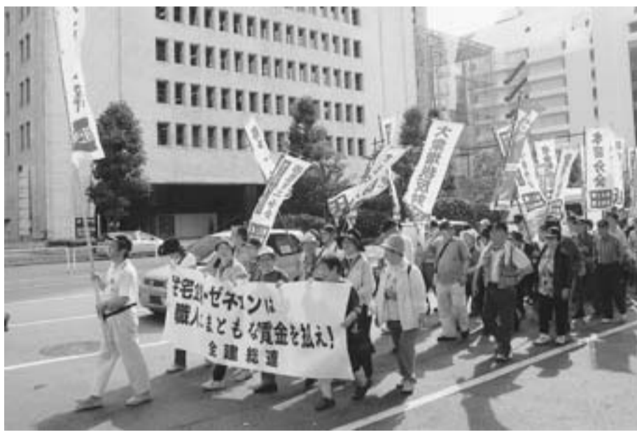
7-6中央集会を終え、デモ行進する支部の仲間たち