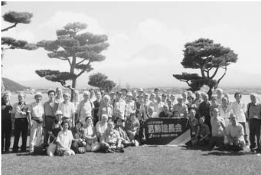
晴天に恵まれて、富士山をバックにハイポーズ

今年度初の建長会の交流会となった日帰りバス旅行は、7月24日(火)に男性42人、女性13人の計55人が参加しました。 建長会のために、久しぶりの晴天となったこの日の朝は、集合時間の30分前にはすでに10人以上の会員が集合している期待の高さ。 甲府市中心街にあるNHK大河ドラマ「風林火山博」見学で武田家の歴史を学び、河口湖畔で懇親会と富士山を眺めながらの露天風呂で、まさにハダカの付き合い。 帰りのバス内では建長会恒例の全員に景品が当たるビンゴゲームを開催。夕方の首都高速での渋滞にはまって柴又の花火大会も間に合わなくなってしまう。バス内ではカラオケでトイレに行きたいのを紛らわしての帰路となりましたが楽しい一日でした。